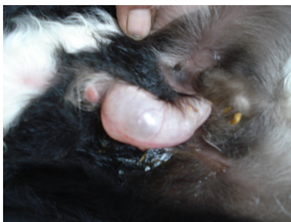
نگاره‌های ۱ و ۲- اتساع ناحیه پریپوس در بزغاله نر دو روز پس از تولد