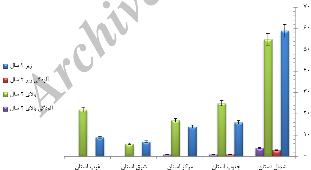
نمودار ۱- توزیع گاوهای نمونه‌برداری شده و فراوانی آلودگی به فاسیولا برحسب گروه سنی و مناطق مختلف استان آذربایجان شرقی

۲ مورد (۴/۸۸ درصد) و از ۳۱ نمونه اخذ شده از مناطق مرکزی ۱ مورد (۳/۲۳ درصد) آلوده به تخم فاسیولا بودند، ولی از ۱۳ نمونه اخذ شده از مناطق شرقی و نیز از ۳۱ نمونه اخذ شده از مناطق غربی استان آلودگی مشاهده نشد. همان طوری که نتایج نشان می‌دهند، بیشترین آلودگی‌ها در جمعیت گاوان به ترتیب مربوط به مناطق شمالی، جنوبی و مرکزی استان می‌باشند. از نظر سنی، از مجموع ۲۳۰ رأس گاو انتخاب شده برای نمونه‌برداری در سطح استان ۱۲۵ رأس (۵۴/۳۵ درصد) بالای ۲ سال و ۱۰۵ رأس (۴۵/۶۵ درصد) کمتر از ۲ سال سن داشتند. بدین ترتیب که از ۱۱۴ رأس گاو در مناطق شمالی ۵۹ رأس زیر ۲ سال و ۵۵ رأس بالای ۲ سال سن داشتند که از این تعداد ۳ رأس گاو (۵/۰۸)