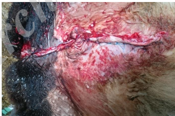
شکل ۳- اصلاح جراحی فتق ناف و هایپوسپدیا و برداشتن بقایای مجرای ادراری