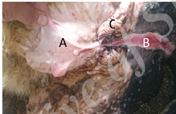
شکل ۲- فتق ناف و کریپتواریکیسم که به همراه هایپوسپدیا رخ داده است. A: فتق ناف، B: هایپوسپدیا، C: کریپتواریکیسم.