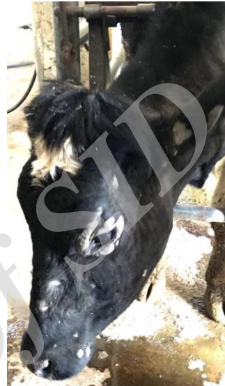
شکل ۱- ضایعات درماتوفیتوز در گوساله ۶ ماهه (تصویر سمت راست) و گاو شیری (تصویر سمت چپ). به ضایعات ضخیم، مجزا و دلمه‌های سفید متمایل به خاکستری در اطراف چشم‌ها، پوزه و گوش‌ها توجه کنید.