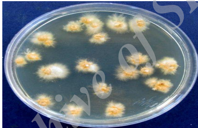
شکل ۳- خصوصیات مورفولوژیکی تریکوفیتون وروکوزوم روی محیط سابورو دکستروز آگار: به کلونی‌های کوچک دکمه‌مانند به رنگ سفید تا کرم، سطحی با قوام مخملی توجه نمایید.