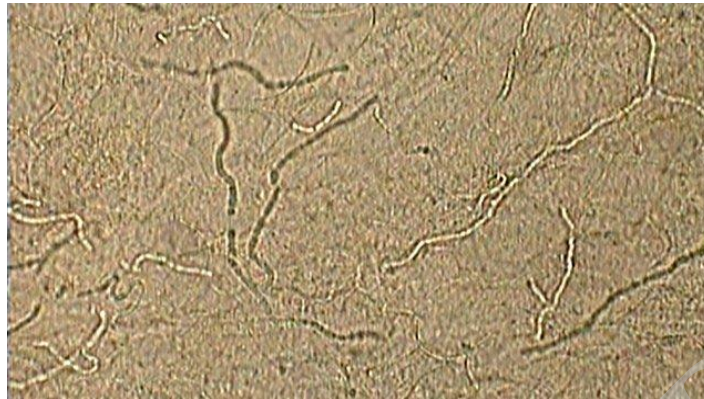
شکل ۲- هایف‌های بلند و واجد دیواره عرضی درماتوفیتی به همراه آرتروکنیدی‌ها در نمونه میکروسکوپی مستقیم تهیه‌شده با هیدروکسید پتاسیم/دی‌متیل سولفوکساید ۲۰ درصد.