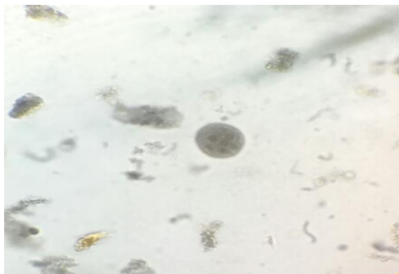
شکل ۲- تروفوزوایت انتامبا کولامی (رنگ آمیزی تری کروم ماسون، درشت‌نمایی ۱۰۰×).