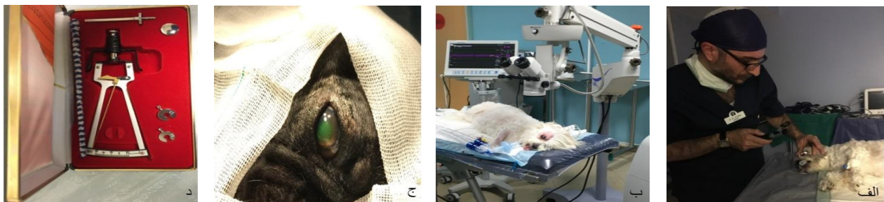
شکل ۱- الف: معاینه چشم با افتالموسکوپ مستقیم، ب: معاینه چشم با میکروسکوپ جراحی، ج: رنگ آمیزی چشم با فلورسئین، د: تونومتر شیوتز

عمومی پنی سیلین ۶,۳,۳ (داروسازی دانا، تبریز، ایران) با دوز ۳۰۰۰۰ واحد به ازای هر کیلوگرم و ضد التهاب غیراستروئیدی ملوکسیکام ۲ درصد (لابراتور رازک، تهران، ایران) با دوز ۰/۲ میلی‌گرم به ازای هر کیلوگرم وزن بدن جهت کاهش درد و التهاب به بیمارستان مراجعه کردند. التهاب لایه عروقی چشم ناشی از عدسی مبتلا به کاتاراکت با قطره‌های چشمی سیپروفلوکساسین ۰/۳ درصد (سینادارو، تهران، ایران) و بتامتازون ۰/۱ درصد (سینادارو، تهران، ایران) و در صورت لزوم پردنیزولون خوراکی مهار گردید. همچنین قطره چشمی آتروپین ۰/۵ درصد (سینادارو، تهران، ایران) جهت کاهش درد و حفظ حرکت مردمک و جلوگیری از چسبندگی (synechiae) تجویز گردید. بخیه قرنیه دو