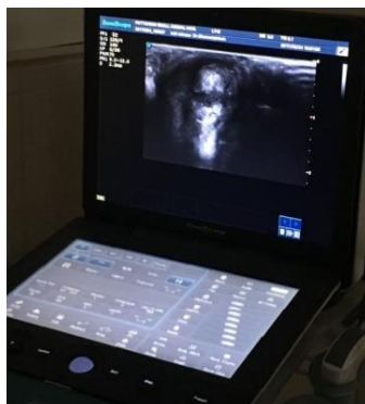
شکل ۲- سونوگرافی چشم برای تشخیص جدا شدن احتمالی شبکیه پیش از جراحی کاتاراکت