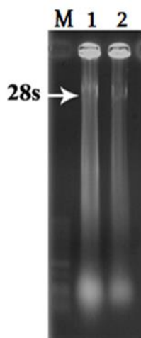
شکل ۱- ژل الکتروفورز شده نمونه‌های RNA استخراج شده. در این عکس چاهک M نشان‌دهنده اندازه DNA و چاهک‌های ۱ تا ۲، مربوط به نمونه‌های RNA (باند مربوط به جزء 28s rRNA) می‌باشد.

لازم به ذکر است که بعد از استخراج RNA و به منظور بررسی کیفیت RNAهای استخراج‌شده، یک میکرولیتر از نمونه RNA بر روی ژل آگارز انتقال داده