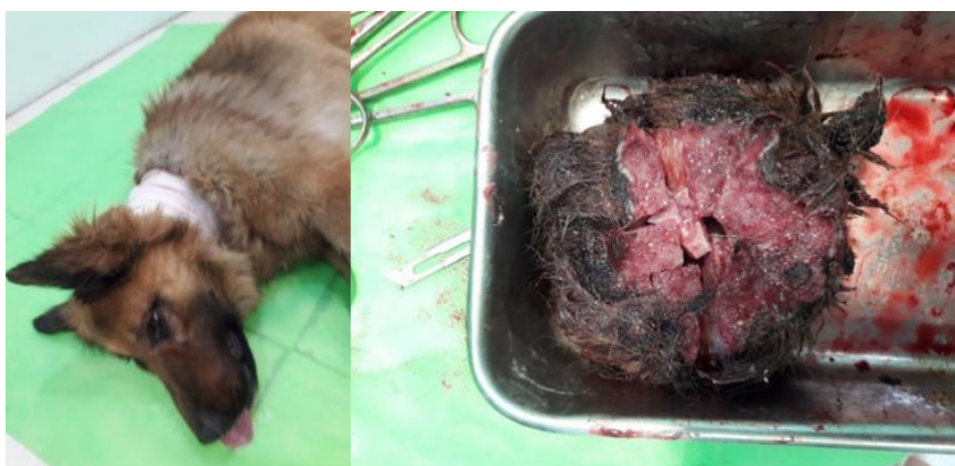
شکل ۲- توده برجسته جلدی برداشته شده از ناحیه گردنی سگ نژاد ژرمن شفرد

مورد دوم: یک قلاه سگ نر نژاد ژرمن شفرد، با سنی حدود ۱۰ سال و وزنی حدود ۳۵ کیلوگرم بود که در یک باغ در اطراف اصفهان نگهداری می‌شده است. علت ارجاع دادن سگ مذکور هم ظهور توده‌ای بزرگ با رشدی سریع و زخم‌شونده در ناحیه پشت گردن و زیر محل قلاه گردنی بود که در ملامسه قوام سفتی داشته است. این توده در ظرف مدت یک ماه (بنابر اظهارات صاحب حیوان) به سرعت قطری حدود ۱۵ سانتی‌متر