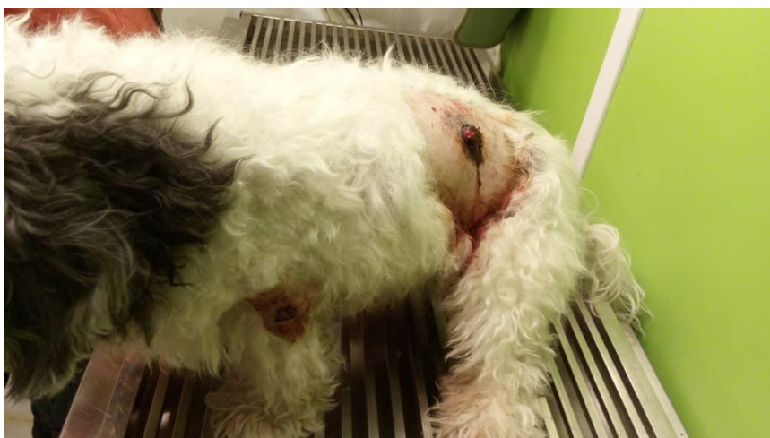
شکل ۱- توده‌های برجسته جلدی بر روی ناحیه تهیگاه و دست چپ سگ نژاد تریر

در دی‌ماه و اسفندماه سال ۱۳۹۷ در مرکز پاتولوژی دامپزشکی اصفهان (بخش خصوصی) با دو مورد تومور پوستی در دو قلابه سگ با نژادهای مختلف برخورد گردید. در مرکز مذکور، نمونه‌برداری‌های بافتی انجام