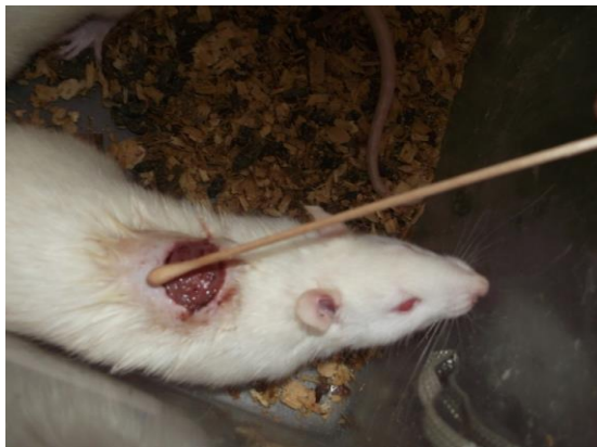
شکل ۳- درمان زخم با عصاره‌های مورد مطالعه

دریافت‌کننده عصاره و یک گروه شاهد بدون درمان)، با استفاده از سوآپ استریل از محل زخم نمونه‌برداری شده و بر روی محیط کشت مک‌کانکی آگار (مرک، آلمان) کشت داده شد و به مدت ۲۴ ساعت در دمای ۳۷ درجه سلسیوس گرمخانه‌گذاری شد. یک روز پس از تایید اولیه عفونی‌شدن زخم با جداسازی باکتری از محل زخم، عصاره‌های مورد نظر هر ۱۲ ساعت و به مدت ۲۱ روز به میزان ۰/۳ میلی‌لیتر بر روی زخم مالیده شد (شکل ۳). گروه سوم موش‌ها نیز به عنوان گروه شاهد بدون استفاده از عصاره‌های مورد آزمایش در محل زخم آن‌ها در نظر گرفته شد ( Kaboutari et al., 2016).