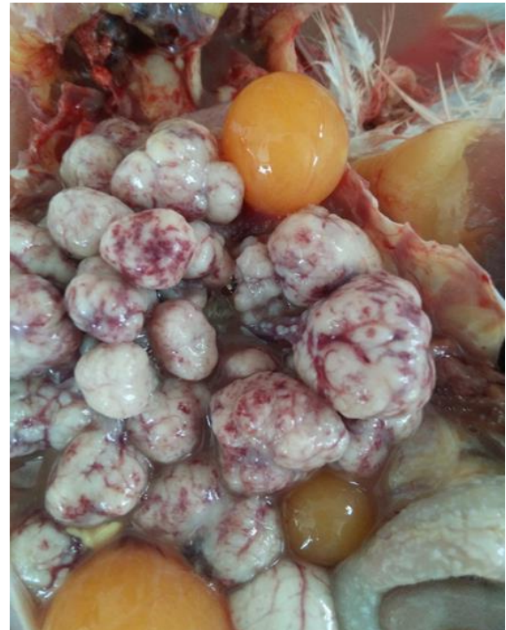
شکل ۱- توموری شدن فولیکول‌های تخمدان