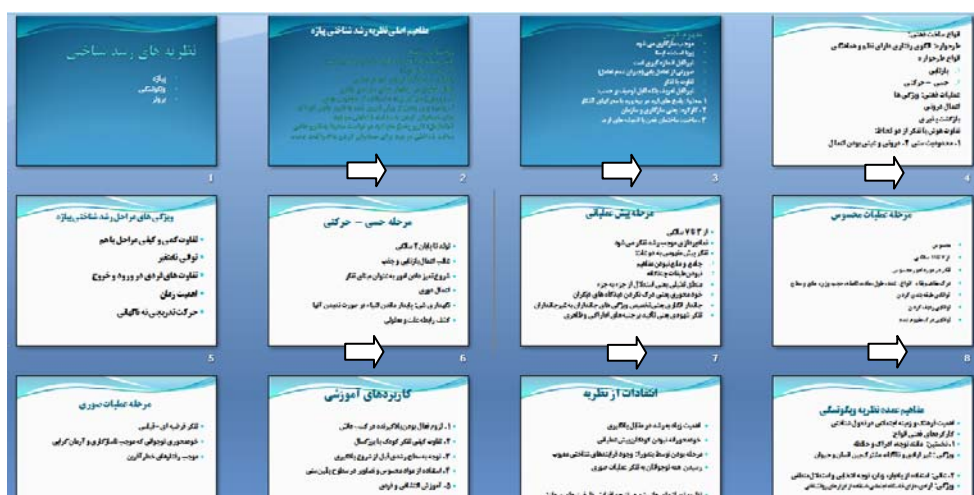
شکل ۱: شیوه خطی و متوالی ارائه محتوای آموزشی در نرم‌افزار PowerPoint (نمونه‌ای مواد آموزشی به کار گرفته شده در طرح پژوهشی حاضر)

علیرغم اهمیت شیوه ارائه شبکه‌ای و به هم مرتبط اطلاعات، توالی مطالب در نرم‌افزار PowerPoint آنالوگ است. در این روش ایده‌ها به دنبال هم می‌آیند نه مرتبط به هم. همان‌گونه که در شکل ۲ مشخص است، اسلایدها مطالبی را ارائه می‌دهند که در یک نظم خطی به دنبال هم می‌آیند. ارائه پشت سر هم این اسلایدها ارتباط بین مطالب اسلایدهای قبلی و بعدی را مشخص نمی‌سازد. چنین توالی بیشتر تأکید بر محتوا دارد. کنچاین(۲۰۰۶) معتقد است که ارائه مطالب پیوسته و پشت سرهم در نرم‌افزار PowerPoint موجب غیرفعال شدن فراگیران می‌شود. چنین شیوه ارائه اطلاعاتی ریشه در یک دیدگاه عینیت‌گرایانه ۱ به آموزش دارد که در این دیدگاه هدف معلم ارائه اطلاعات است. در حالی که اکنون شیوه‌های جدید آموزشی مبتنی بر دیدگاه سازنده‌گرای ۲ هستند.