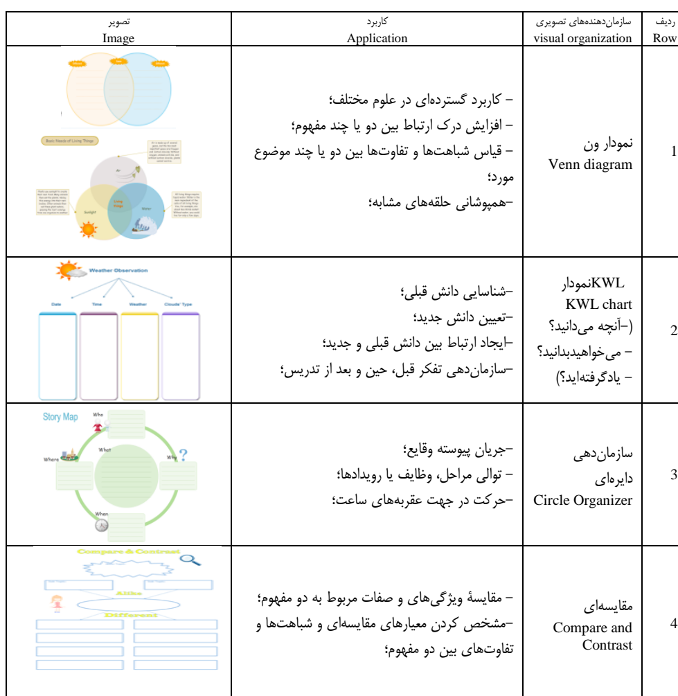
Table 5 visual organization used in the research

جدول ۵: سازمان‌دهنده‌های تصویری استفاده شده در پژوهش