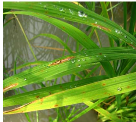
شکل ۲- نمایش لکه‌های دوکی شکل حساسیت (بالا) مربوط به والد مادری و لکه‌های کوچک میلی‌متری مقاومت (پائین) مربوط به لاینهای اصلاح شده.

در نتیجه این پژوهش دو ژن مقاوم به بلاست برنج (Pi-1 و Pi-2) به رقم حساس طارم دیلمانی منتقل شدند. رقم ترمیم شده طارم دیلمانی در مقابل جدایه‌های قارچ عامل بلاست در منطقه مقاومت نشان داد. تیپ آلودگی درجه ۴ و ۵ (حساسیت) که قبل از انجام پژوهش وجود داشت به تیپ آلودگی درجه ۱ و ۲ (مقاومت) تبدیل شد. مورفولوژی گیاه و کیفیت آن تغییر جزئی نمود اما