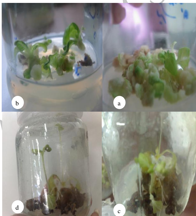
شکل ۱- a- تولید برگ‌های اولیه از کالوس، b- رشد برگ‌ها، c- ادامه رشد و تشکیل ساقه و d- شکل‌گیری اندام هوایی کامل

تعادل هورمون‌های رشد در محیط القای شاخه یک اثر کنترلی بر روی مورفوژنز دارد. سطوح مختلف هورمون‌های خارجی نقش بسیار مهمی در تشکیل شاخه دارند و شدیداً روی مورفوژنز تأثیرگذار هستند (۱۵). حدود دو هفته پس از واکشت، شاخساره‌های باززا