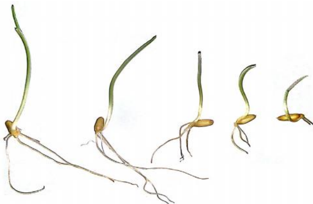
شکل ۱- تأثیر دُزهای مختلف پرتو گاما (از چپ به راست به ترتیب صفر، ۱۰۰، ۲۰۰، ۳۰۰ و ۴۰۰ گری) بر جوانه‌زنی بذر رقم سرداری گندم نان Figure 1. The effect of different doses of gamma irradiation (0, 100, 200, 300 and 400 Gary. left to right, respectively) on seed germination of Sardari bread wheat

نتایج مقایسه میانگین‌ها برای صفت طول ساقه‌چه بیانگر تفاوت معنی‌داری بین دُزهای مختلف پرتوتابی بود. به طوری که دُز شاهد و ۱۰۰ گری بالاترین و دُزهای ۳۰۰ و ۴۰۰ گری کمترین مقدار را داشتند (شکل ۱ و جدول ۳). برای این صفت بهترین برازش توسط معادله درجه ۱ رگرسیونی انجام شد و دُز ۲۵۴/۵۵ را دُز مناسب برای کاهش ۳۰ درصد طول ساقه‌چه بیان کرد (جدول ۴). نتایج حاصل از تجزیه همبستگی نشان داد که در بین تمامی صفات بالاترین ضریب همبستگی مربوط به وزن تر و وزن خشک ساقه‌چه (۰/۹۶) و همچنین وزن تر و وزن خشک ریشه‌چه (۰/۹۶) بود و کمترین ضریب همبستگی بین درصد جوانه‌زنی و سرعت جوانه‌زنی (۰/۱) وجود داشت (جدول ۵). نتایج مقایسه میانگین‌ها برای صفت وزن خشک ریشه‌چه و وزن خشک ساقه‌چه نشان داد با افزایش دُز پرتوتابی، وزن خشک به‌طور معنی‌داری کاهش می‌یابد (جدول ۳).