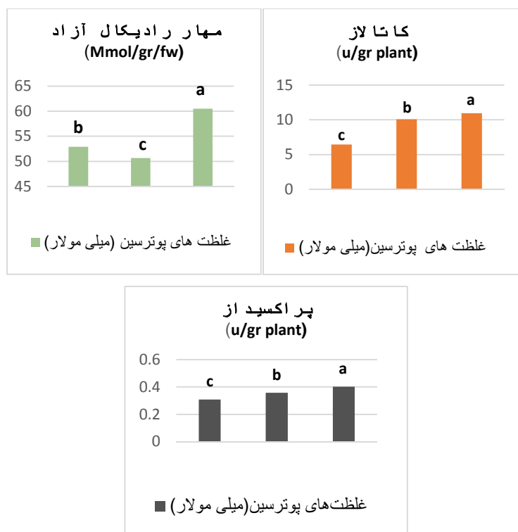
شکل ۱- مقایسه میانگین اثرات پوترسین بر آنزیم‌های آنتی‌اکسیدانی در گیاه استویا Figure 1. Means comparison of the effects putrescine on some antioxidant characters of stevia plant در هر ستون میانگین‌هایی که دارای حداقل یک حرف مشترک هستند اختلاف آماری معنی‌داری ندارند.