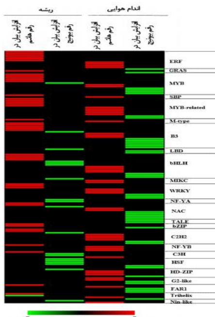
شکل ۳- الگوی بیان اعضای خانواده‌های عوامل رونویسی در مقایسه بین ارقام متحمل و حساس در بافت‌های ریشه و هوایی در پاسخ به تنش خشکی، مقیاس رنگی بر اساس \log_2 fold change