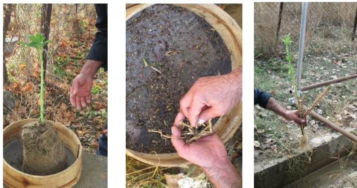
شکل ۱- مراحل شستشوی گلدان‌ها جهت شمارش تعداد گل‌جالیز Figure 1. Pots washing steps in order to counting the number of Orobanchae

بین شاخص‌های تحمل و عملکرد برگ توتون در شرایط گل‌جالیز دار (محیط تنش دار) و بدون گل‌جالیز (محیط نرمال)، تعیین شاخص‌های مهم در شناسایی ارقام مقاوم و حساس و گروه‌بندی ارقام مورد مطالعه توتون از نرم‌افزار SPSS نسخه ۲۱ (۴۰) استفاده گردید.