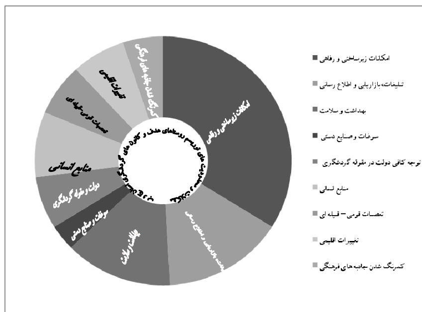
شکل ۱. مدل اولیه میدانی تحقیق

عمده و اصلی این مرحله از تحقیق، ایجاد خط سیر داستان ۱ است که همه طبقات را دربرمی‌گیرد (قبادی به نقل از پاپ زن، ۱۳۸۹). در ادامه مدل اولیه تحقیق (پایه‌گذاری مدل)، که بخش عمده آن شامل دیدگاه‌های آگاهان روستایی، گردشگران داخلی و گردشگران خارج از استان است، آورده می‌شود.