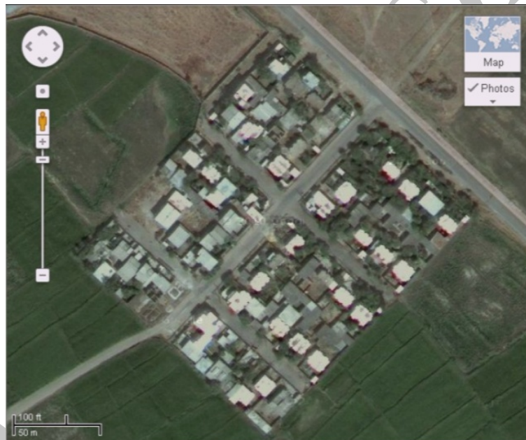
شکل ۱. عکس هوایی از شهرک منابع طبیعی

شکل ۱ مشخص است این محله -که شامل یک خیابان اصلی و دو چهارراه کوچک است- در واقع شهرک نیست، بلکه کوچه یا محله‌ای کوچک به ابعاد تقریبی 150 \times 170 متر است. ولی چون نام رسمی ندارد و ساکنان محلی آن را «شهرک منابع طبیعی» یا «محله کوهساری‌ها» (به معنای کوه‌نشینان) می‌خوانند، از این نام استفاده شده است که در ادامه به اختصار «شهرک» ذکر می‌شود. اکنون در شهرک منابع طبیعی تقریباً ۴۰ خانوار کوهساری و ۱۰ خانوار مهاجر سیستانی زندگی می‌کنند.