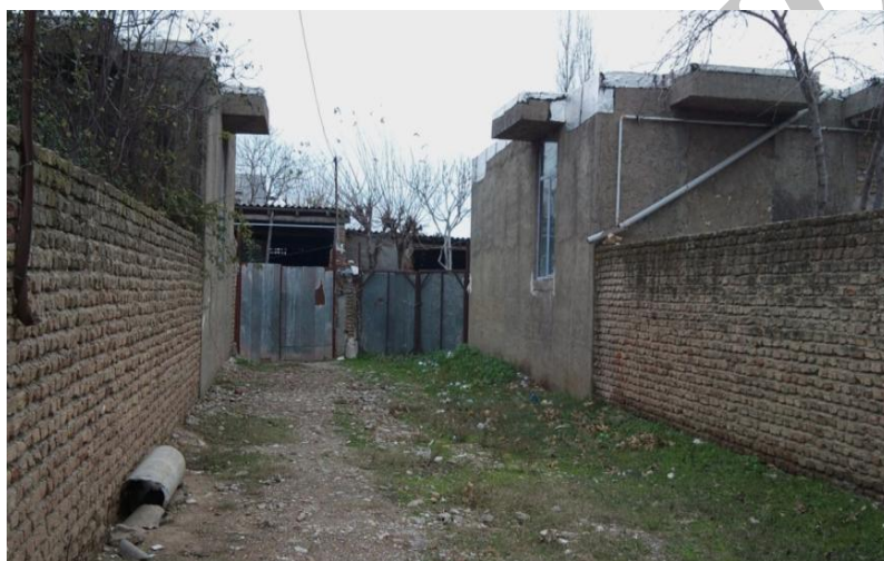
شکل ۲. نمایی از خانه‌ها و آغل‌های واگذارشده به مهاجران

نمونه‌گیری پژوهش حاضر از مفاهیم صورت گرفته است و نه از افراد. تحقیق پیش رو، حاصل تحلیل ۲۶ مصاحبه با روستانشینان (۱۲ مصاحبه در مرحله اول و ۱۴ مصاحبه در مرحله دوم) و ۹ مصاحبه با مسئولان اجرایی ذی‌ربط (فرمانداری، اداره منابع طبیعی و سازمان جهاد کشاورزی) است که مطابق توضیح، کدگذاری و مفهوم‌یابی شده‌اند.