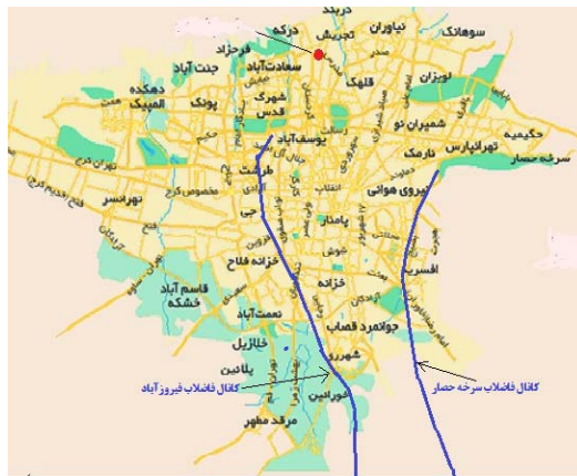
شکل ۲. مسیر کانال‌های فاضلاب فیروزآباد و سرخه‌حصار در شهر تهران

میدان بسیج در منتهی‌الیه جنوب شهر تهران جاری می‌شود و از آنجا وارد زمین‌های حریم جنوبی شهر می‌گردد (شکل ۲).