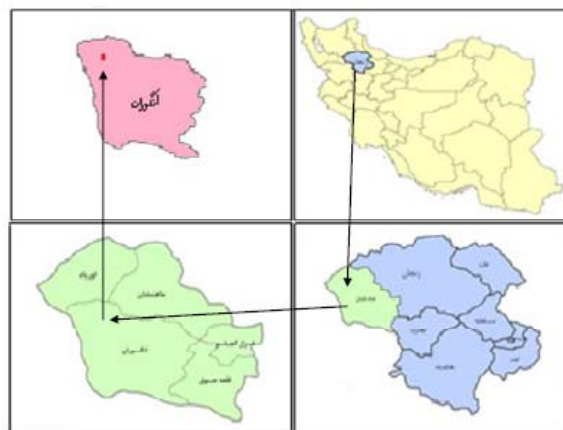
شکل ۱. منطقه مورد مطالعه