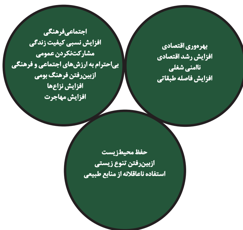
تصویر ۳. الگوی ابعاد توسعه پایدار گردشگری در روستای آهار.