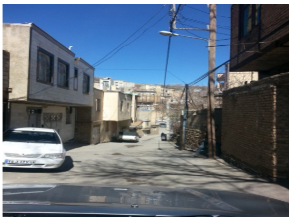
تصاویر پژوهش‌های روستایی

جامعه آماری این پژوهش، ساکنان روستای دره مرادبیگ و گردشگران اعم از جوانان و افراد مسن بودند و حجم نمونه سی نفر از ساکنان روستا و عابران را شامل می‌شد که به روش نمونه‌گیری