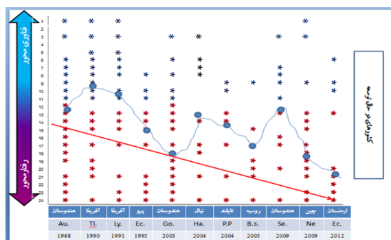
تصویر ۲. الگوی زیست‌بوم‌های پایدار کشورهای در حال توسعه

این امر درباره زیست‌بوم‌های پایدار ژاپن و انگلستان نیز باتوجه به پیشینه فناوری و صنعتی آن‌ها، توجیه‌کردنی است. استرالیا باتوجه به اینکه از نظر شاخص توسعه انسانی (۲۰۱۵) رتبه درخور توجهی در میان کشورهای توسعه‌یافته دارد، تکیه بر راهبرد رفتارمحور در کنار راهبرد فناوری‌محور را در دستور کار توسعه زیست‌بوم‌های پایدار خود قرار داده است. در تصویر شماره