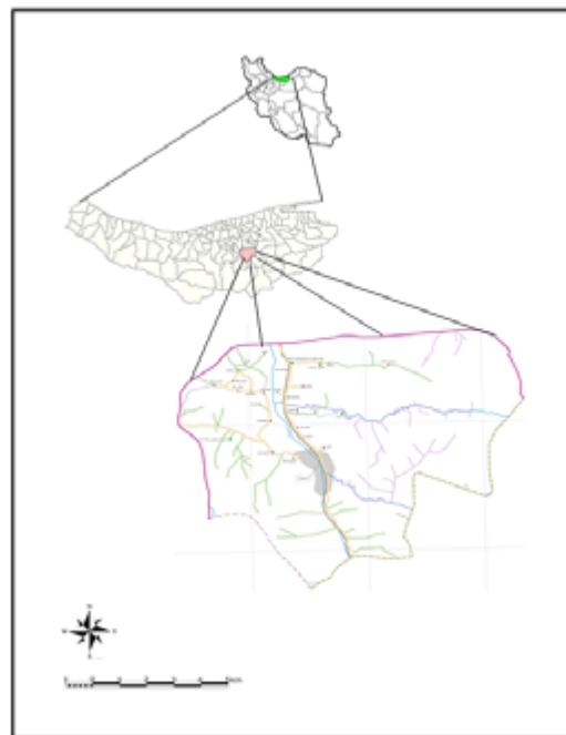
تصویر ۱. نقشه بخش نارنجستان؛ اقتباس از نقشه شهرستان سوادکوه شمالی (Governorate of North Savadkouh County, 2016) فصلنامه پژوهش‌های روستایی