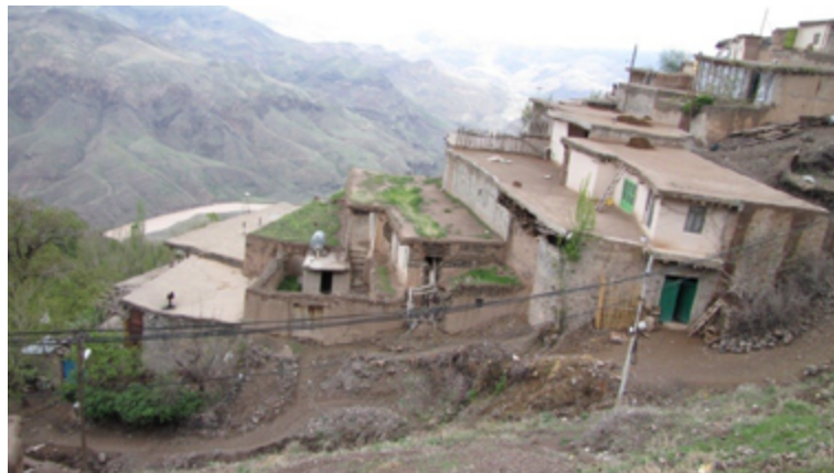
فصلنامه پژوهش‌های روستایی

انسان غارنشین همواره در تیررس مرگ و نابودی و توالی‌های طبیعت و نیازمند فضایی بود که بتواند در امتداد طبیعت به زندگی بپردازد. او در جست‌وجوی فضای بسته‌ای بود که خود را در داخل آن پناه دهد و در امان باشد (Homayun, 1974). شکل‌گیری تجربه مستمری از زندگی موجب حفظ او از دست مرگ شده و او را زنده نگه می‌دارد و راز این جاودانگی، پنهان شدن انسان‌های