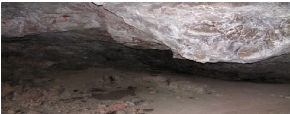
فصلنامه پژوهش‌های روستایی