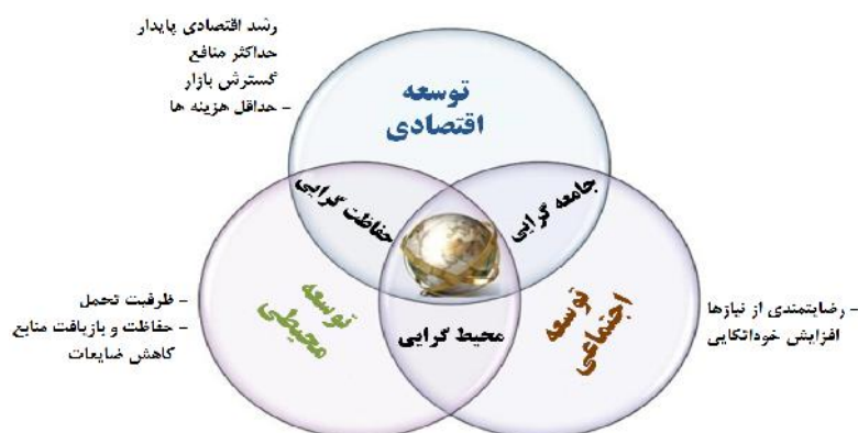
تصویر ۱. رویکردها و معیارهای تبیین‌کننده توسعه پایدار.

عدالت؛ یعنی ظرفیت جامعه در توزیع عادلانه فرصت‌ها و تهدیدهایی که ناشی از کاربرد یا تغییر نظام‌های طبیعی محیط هستند. مانند آنچه از فرایند توسعه حاصل می‌شود (New Urban Agenda, 2017:1).