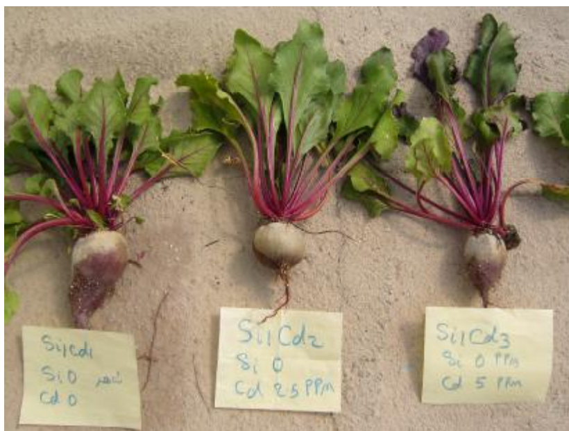
شکل 3- از چپ به راست: تیمار شاهد (بدون Cd و Si)، تیمار 2/5 میلی گرم در لیتر Cd و صفر میلی گرم در لیتر Si، تیمار 5 میلی گرم در لیتر Cd و صفر میلی گرم در لیتر Si.