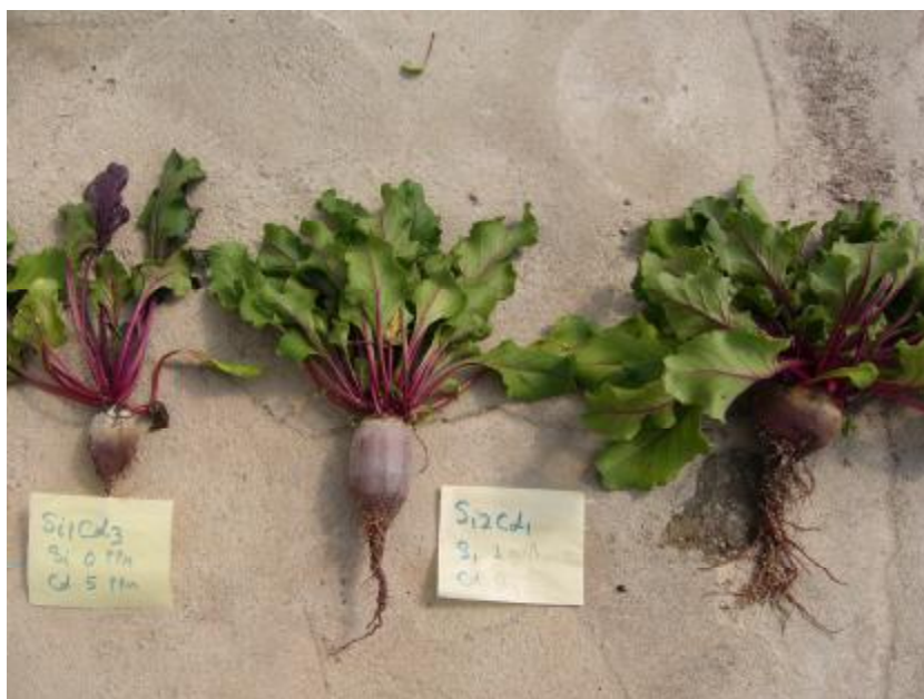
شکل 4- از چپ به راست: تیمار 5 میلی گرم در لیتر Cd و صفر میلی گرم در لیتر Si (Si1Cd3) و دو گیاه مربوط به تیمار Si2Cd1 (Cd صفر و Si 28 میلی گرم در لیتر)

باعث آسیبهای اکسیداتیو به وسیله رادیکالهای آزاد اکسیژن می شود. همچنین، زیادی مواد اکسیداتیو باعث افزایش موادی نظیر MDA شده و پراکسیداسیون لیپید افزایش می یابد (شی و همکاران 2005). در این آزمایش