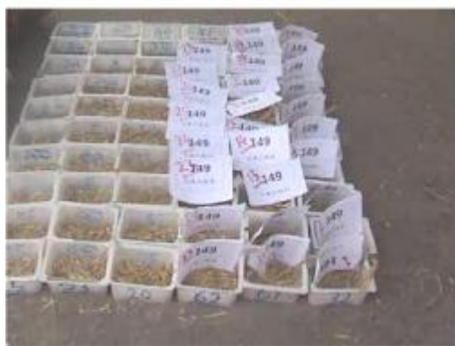
شکل 5- نحوه ثبت مواد دانه‌ای جدا شده در کوبنده و

بعد از هر آزمایش، دانه‌های آزاد (کوبیده شده) منتقل شده به قسمت غربال که همراه با مواد غیر دانه‌ای (MOG) از عقب کمباین روی پارچه‌ی پهن شده روی زمین می ریخت، توسط الک هایی به صورت دستی جدا و با ثبت شماره آزمایش، توسط ترازوی دیجیتالی با حساسیت 0/01 گرم وزن و یادداشت می شد. مواد داخل سلول ها نیز پس از ثبت شماره آزمایش و شماره سلول، به داخل کیسه های کوچک خالی شده و پس از جداسازی از مواد غیردانه‌ای رد شده از سوراخ های ضدکوبنده، توسط یک ترازوی دیجیتالی حساس توزین و یادداشت شد. نمونه‌ای از نحوه‌ی ثبت مواد دانه‌ای جدا شده در کوبنده و ریخته شده در داخل سلول ها در شکل 5 نشان داده شده است.