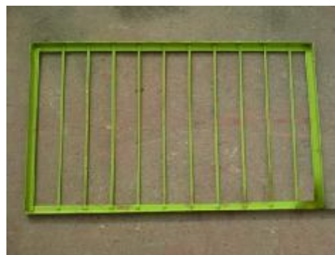
شکل 2- سینی شبکه بندی

آذربایجان، استفاده گردید. در این طرح ابتدا اندام‌های مربوط به هد، کاه پران، چنگک هم زن، دمنده، الک‌ها و ماردم‌های مربوط به دانه تمیز و کزل، با توجه به عدم نیاز در این آزمایش‌ها، از روی کمباین برداشته شد و سپس یک عدد سینی شبکه بندی شده در ابعاد 1050 \times 610 میلیمتر برای سنجش میزان جداسازی دانه از نقاط مختلف ضد کوبنده ساخت شد (شکل 2).