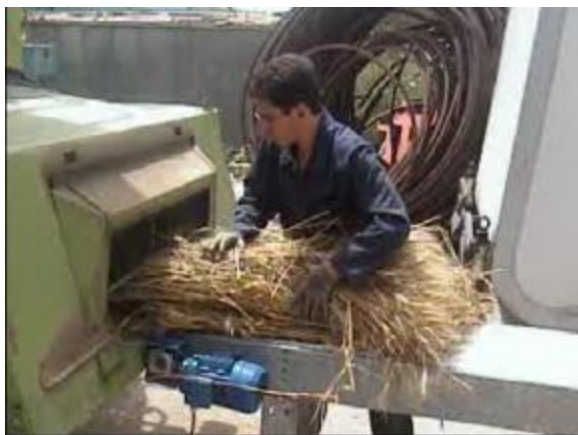
شکل 4- نحوه ی تغذیه مواد به نقاله تغذیه کمباین

نقاله تغذیه و به دنبال آن به فضای کوبنده و ضدکوبنده تغذیه می گردید (شکل 4).