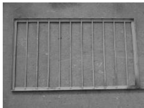
شکل 2- سینی شبکه بندی شده

با توجه به اینکه در سال زراعی 88-87 اکثر سطح زیر کشت مناطق آبی دشت مغان به کشت گندم آبی - رقم شیروزی اختصاص داشت، همین رقم برای انجام آزمایش ها انتخاب گردید. محصول آزمایشی مورد نظر به میزان از قبل تعیین شده و به مدت یک هفته قبل از موسم برداشت، در اندازه های پنج کیلوگرمی و در سه سطح ارتفاع ساقه با دست برداشت شده و سپس توسط کامیون از مغان به محل انجام آزمایشات (شرکت گسترش و توسعه صنعت آذربایجان) منتقل و در واحد تحقیق و توسعه شرکت گسترش انبار گردید. برای حفظ رطوبت اولیه و نیز جلوگیری از اثرات تغییرات آن در طول آزمایش ها، محصول برداشت در داخل کیسه های بزرگ نایلونی قرار داده شد.