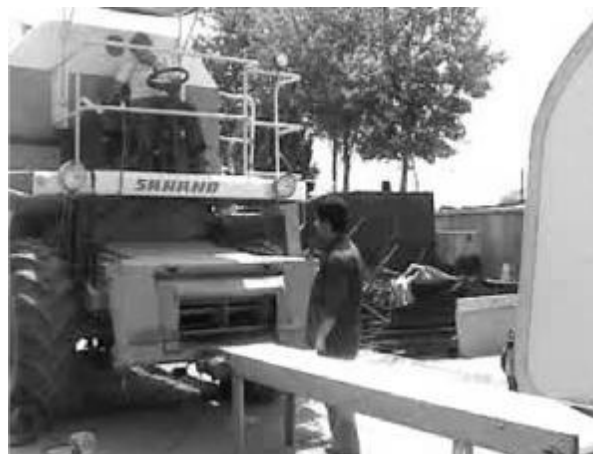
شکل 3- نحوه ی قرارگیری تسمه نقاله در جلوی کمباین

برای خالی کردن آسان محتوای هریک از سلول های داخل سینی شبکه بندی شده نیز از ظروف یک بار مصرف با ابعاد 95/45 \times 76/25 میلی متر به تعداد 88 (با در نظر گرفتن مساحت تصویر فضای کوبش) استفاده شد. برای تغذیه یکنواخت مواد به نقاله تغذیه و به دنبال آن به فضای کوبش، از یک دستگاه تسمه نقاله دو متری سرعت متغیر استفاده گردید. سپس این تسمه نقاله در جلوی نقاله تغذیه کمباین قرار داده شد. شکل 3 نحوه ی قرارگیری تسمه نقاله در جلو کمباین مورد نظر را نشان می دهد.