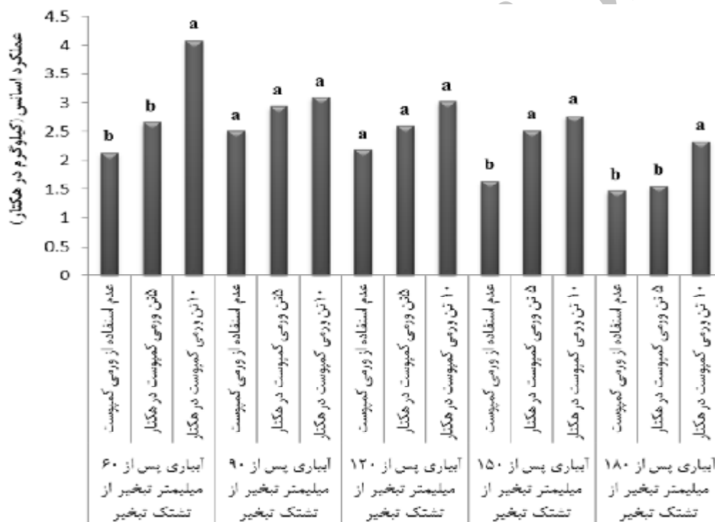
شکل 5- مقایسه میانگین عملکرد اسانس بایونه در سطوح تنش خشکی و ورمی کمپوست

در سطوح آبیاری پس از 60، 150 و 180 میلی‌متر تبخیر از تشتک تبخیر، بیشترین عملکرد اسانس مربوط به سطح ورمی کمپوست 10 تن در هکتار و کمترین عملکرد اسانس مربوط به سطح عدم استفاده از ورمی کمپوست بود. از آنجایی که عملکرد اسانس تابعی از درصد