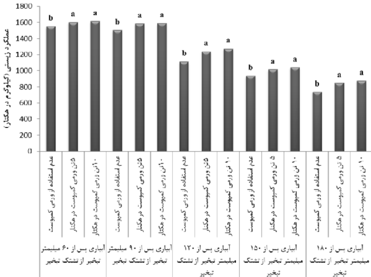
شکل 3- مقایسه میانگین عملکرد زیستی بابونه در سطوح تنش خشکی و ورمی کمپوست

همراه با عملکرد زیستی و عملکرد گل مورد بررسی قرار داد.