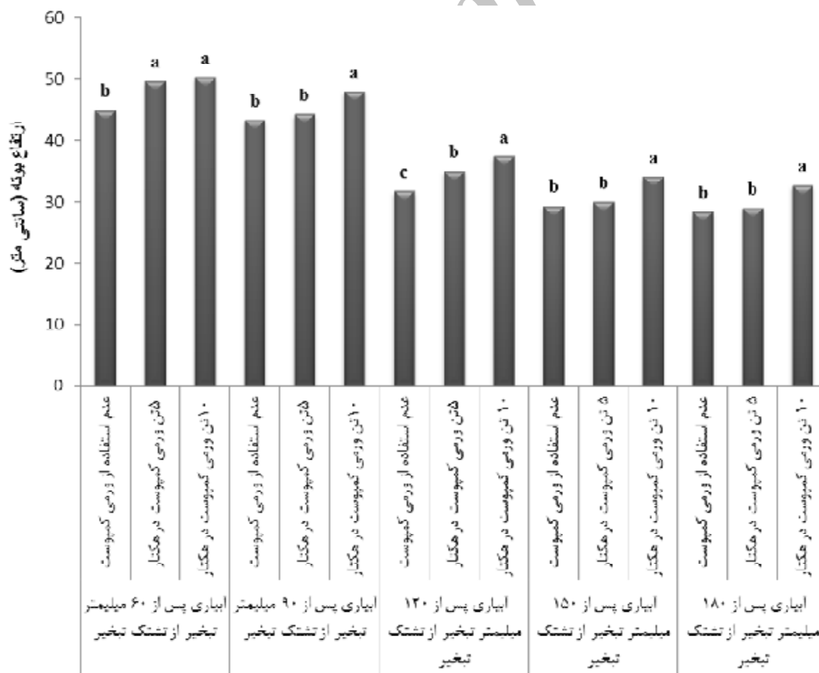
شکل 1- مقایسه میانگین ارتفاع بابونه در سطوح آبیاری و ورمی کمپوست

کمپوست)، تنش خشکی بیشترین تأثیر را بر کاهش ارتفاع داشته و کمترین ارتفاع مربوط به سطح تنش خشکی 180 میلی متر تبخیر از تشنگ مشاهده گردید (شکل 1). در این مطالعه به نظر می رسد ورمی کمپوست از طریق قدرت زیاد جذب آب و فراهمی مطلوب عناصر غذایی پرمصرف و کم مصرف بر روی میزان فتوسنتز و تولید زیست توده تأثیر مثبت گذاشته و موجب بهبود ارتفاع بوته شده است. هم چنین در مطالعه ای دیگر بر روی گیاه دارویی سیر ( Allium sativum )، استفاده از ورمی کمپوست موجب بهبود چشمگیری در ارتفاع بوته گردید (آرگوئلو و همکاران 2006). در این پژوهش ارتفاع بوته سیر نیز به دلیل بهبودی که در جذب عناصر معدنی و آب و پیامد آن در فرایند فتوسنتز صورت گرفته بود، افزایش یافت. نتایج مشابهی نیز در همین