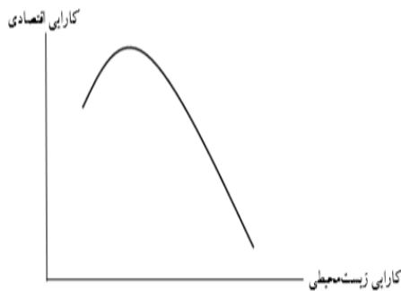
شکل ۲-ارتباط کارایی زیست محیطی و کارایی اقتصادی (دیدگاه سنتی)

اقتصادی به شکل یک منحنی نزولی خواهد بود (شکل ۲)؛ دیدگاه تجدید نظر طلب: ارتباط بین کارایی اقتصادی و زیست محیطی به شکل U معکوس با سطح بهینه کارایی زیست محیطی ارائه می شود (شکل ۳). در واقع، نقطه عطف دیدگاه تجدید نظر طلب از فرضیه پورتر در سال ۱۹۹۱ و نظریه ای که پورتر و وندرلیند در سال ۱۹۹۵ داده اند می باشد. این فرضیه مبنی بر این بود که عملکرد زیست محیطی به عنوان منبعی بالقوه برای مزیت رقابتی می باشد.