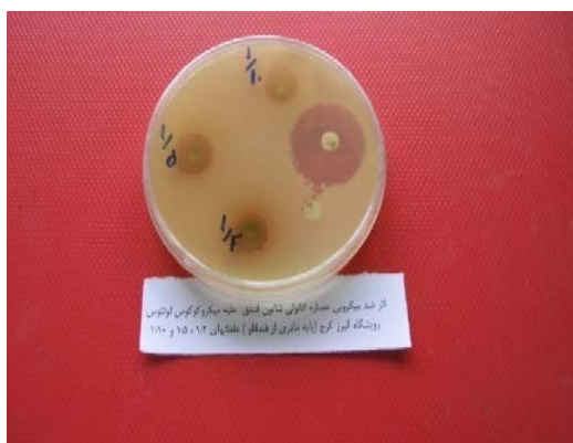
شکل ۳- نمونه کشت باکتری میکروکوکوس اوتئوس

رویشگاه های مختلف در جدول های ۸ الی ۱۰ آورده شده است. بر اساس این نتایج بین باکتری ها، عصاره ها و اثرات متقابل باکتری های حساس و عصاره ها در رویشگاه مکش و البرز (با منشأ مکش)