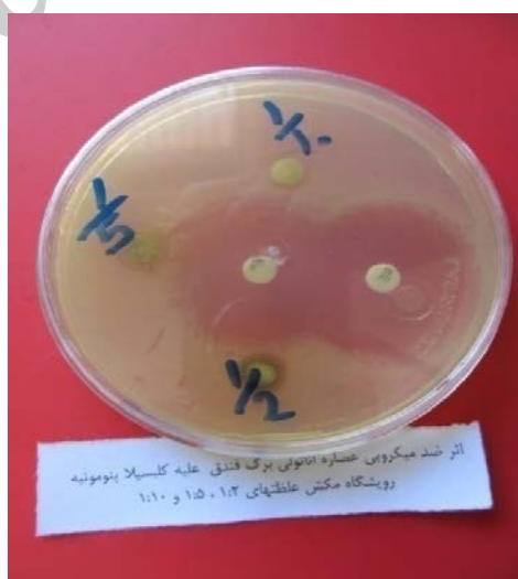
شکل ۲- نمونه کشت باکتری کلبسیلا پنومونیه

گروه‌بندی باکتری‌های حساس نشان دهنده‌ی حساسیت بالای کلبسیلا پنومونیه با قرار گرفتن در رویشگاه‌های فندقلو، رویشگاه البرز با منشأ مکش و رویشگاه البرز با منشأ فندقلو بود. اما