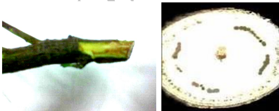
شکل ۲- خطوط ناپیوسته ایجاد شده در برش عرضی و طولی ساقه زیتون مایه‌زنی شده با ( V. dahlia )