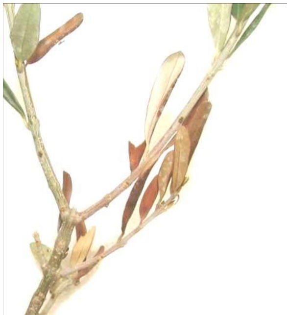
شکل ۱- علائم پژمردگی و خشکیدگی برگ‌های زیتون رقم زرد مایه‌زنی شده با جدایه E4 عامل بیماری ( V. dahliae )

حضور عامل بیماری، ترکیباتی همچون تایلوز و مواد ژلاتینی نیز دیده شد (شکل ۴).