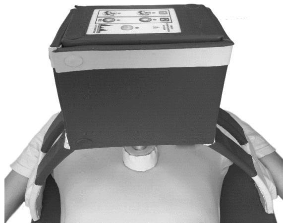
Fig. 4 How to install the device on the patient