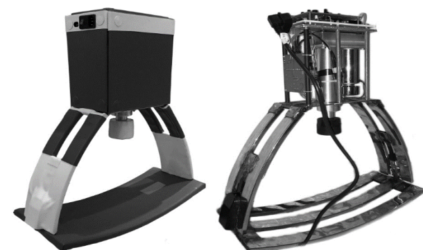
Fig. 3 Assembled device before adding cover and case (right) and completed device (left)

شکل 2 کنترل پنل رابط کاربری (تصویر بالا) و مدارهای الکترونیکی مربوطه (تصویر پایین)