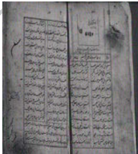
صفحه نخستین نسخه خطی ۱۱۳۲