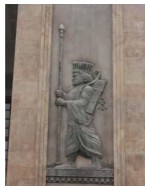
تصویر شماره ۱۰: نقش برجسته (سرباز هخامنشی) به کار رفته در بنای بانک ملی