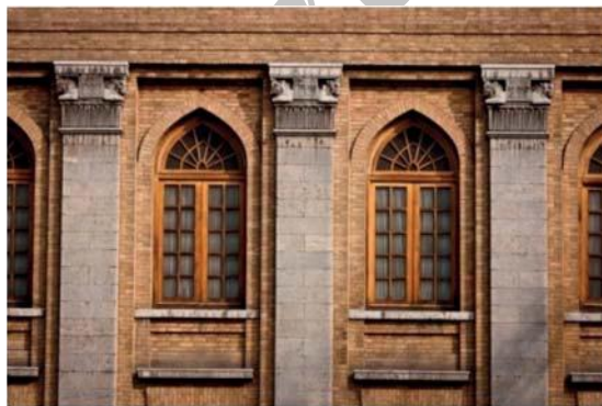
تصویر شماره ۲۲: تلفیق نیم ستونها و سرستون‌های هخامنشی با قوس‌های جناغی دوره اسلامی در ساختمان اداره پست (منبع: نگارندگان)