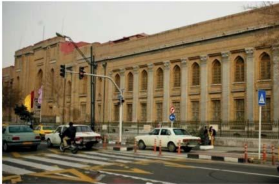
تصویر شماره ۲۱: اداره پست (۱۳۱۳-۱۳۰۷ ه.ش) طراحی نیکلای مارکوف معمار گرجستانی تبار روسی

بنای اداره پست (۱۳۰۷-۱۳۱۳ ه.ش)، ساختمانی سه طبقه است که توسط نیکلای مارکوف ۱۳ معمار گرجستانی تبار روسی ساخته شد. این بنا یک بنای کاملاً التقاطی است، زیرا در نمای آن از نیم ستون‌های سنگی با سرستون‌های دوره هخامنشی و قوس‌های جناغی دوره اسلامی استفاده شده است و پلان و مقطع آن نیز به شکل باسیلیکا طراحی گردید (تصاویر شماره ۲۱ و ۲۲).