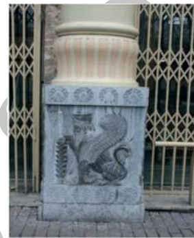
تصویر شماره ۸: نقش برجسته (زُرت، گریفین، نیلوفر) به کار رفته پایه ستون ساختمان شرکت سهامی فرش