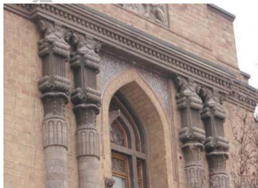
تصویر شماره ۱۳: استفاده از کاشی کاری و تاق جناغی با تقلید از معماری دوران اسلامی در بنای وزارت امور خارجه

این بنا در سال ۱۳۱۵ هـ.ش توسط قلیچ باغلیان ۹ طراحی شده است. در نماسازی این بنا از تزیین‌ها و عناصر معماری ایران باستان نظیر پلکان دو طرفه، ستون‌ها و سرستون‌ها، نقش برجسته‌ها و کنگره‌ها استفاده شد. در برخی از قسمت‌ها عناصر معماری اسلامی نظیر تاق جناغی (نوک تیز) نیز دیده می‌شود. اما درون ساختمان بر اساس نیازهای جدید طراحی گردید. (تصاویر شماره ۱۳ و ۱۴).