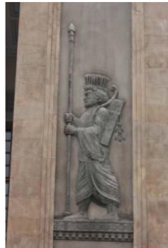
تصویر شماره ۱۸. نقش برجسته سرباز هخامنشی در بنای بانک ملی

شرکت سهامی فرش ایران در سال ۱۳۱۴ با دستور دولت وقت احداث شد. قدمت این ساختمان متعلق به اواخر قاجاریه و اوایل