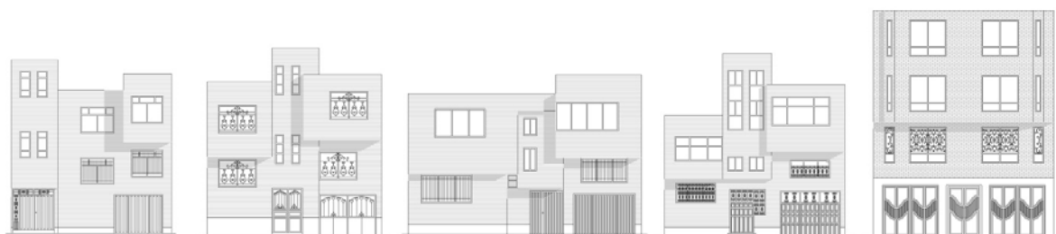
تصویر شماره ۵: چند نمونه از پوسته خانه‌های مدرن در تبریز