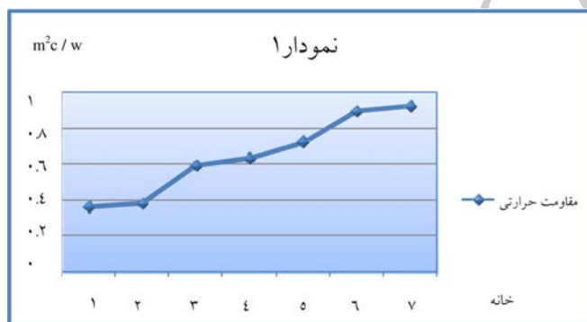
نمودار شماره ۱: مقاومت حرارتی پوسته‌ها در بناهای مسکونی سنتی و مدرن شهر تبریز