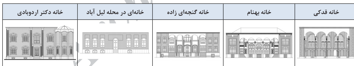
تصویر شماره ۲: پوسته تعدادی از بناهای مسکونی شهر تبریز

در جدول فوق دوره ساخت بناهای سنتی تبریز ارائه شده است. نام‌سازی خانه‌های سنتی تبریز مانند بافت شهری متراکم بر اساس اقلیم منطقه و برای مقابله با سرمای شدید طراحی شده‌اند و دارای بازشوها و ایوان‌های کوچک و دیوارهای قطور هستند (قبادیان، ۱۳۸۴: ۱۰۳). بازشوها و ایوان‌های کوچک و دیوارهای قطور عاملی در جهت کاهش انتقال حرارت هستند. یکی از مهم‌ترین الگوها در طرح خانه سنتی تبریز با باطن‌گرایی و مفهوم‌گرایی اسلامی، استفاده از تقسیمات به صورت اعداد فرد (سه، پنج، هفت) در بدنه‌ها و نماها بخصوص در ریتم پنجره‌ها،