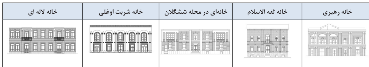
تصویر شماره ۳: چند نمونه از پوسته بناهای مسکونی سنتی شهر تبریز