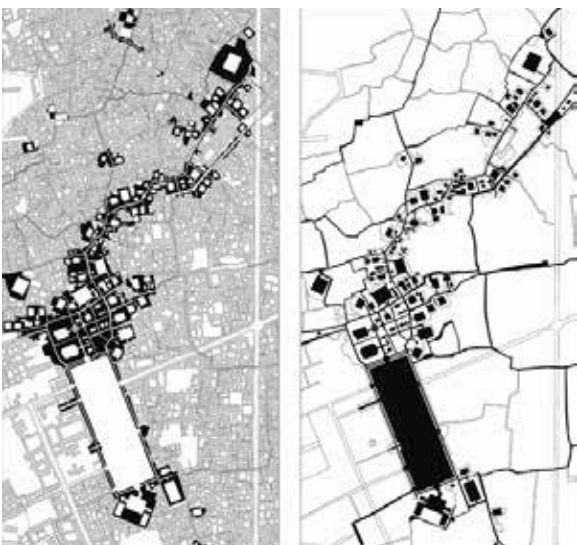
تصویر شماره ۱: نقشه توده فضا و موقعیت مسجد جامع اصفهان، بازار و میدان نقش جهان (نقشه‌های سازمان نقشه برداری استان اصفهان)

مسجد جامع عتیق اصفهان در محل روستای قدیمی یاوان بنا شده است. به دلیل نقش و اهمیتی که مساجد جامع به طور کلی و مسجد جامع عتیق اصفهان به طور خاص، در زندگی مردم داشته است، این بنا در مرکز شهر و در مجاورت مراکز حکومتی، اقتصادی (بازار) و اجتماعی (میدان سلجوقی) شکل گرفته است. سپس عناصر اصلی شهر از جمله مدارس و حمام‌ها در ارتباط با این مجموعه قرار گرفتند. در دوره صفوی با ساخت میدان نقش جهان، راستای بازار و مسجد جامع جدید، مرکز شهر به سمت جنوب منتقل شد. مسجد جامع عتیق هم اکنون نیز در مرکز بافت تاریخی شهر قرار گرفته است.