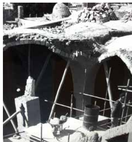
تصویر شماره ۴ و ۵: بازسازی پس از بمباران، مأخذ: اطلاعات موجود در مسجد جامع