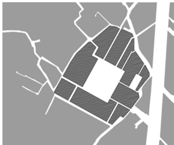
تصویر شماره ۸: ارتباط بنا و شبکه معابر بر اساس عکس هوایی سال ۱۳۳۵

این شکل ارتباط مساجد با گذرهای عمومی بهترین صورت بیان کالبدی مفهوم مسجد به عنوان خانه خدا، خانه‌ای متعلق به همه بوده است (توسلی، ۱۳۷۱: ۴۶). در سال‌های اخیر، به منظور