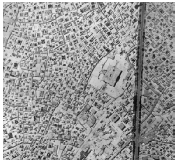
تصویر شماره ۷: عکس هوایی سال ۱۳۳۵؛ مأخذ: فقیه، ۱۳۵۴

مسیرها و گذرهای شهری قرار نگرفته است، بلکه خود جزئی از شبکه معابر و «همانند یک گره، پیوند دهنده مسیرها و گذرهای شهر شده است» (تولایی، ۱۳۸۷: ۴۵). شبستان‌ها را می‌توان گذرگاه‌هایی دانست که به صورت واسطه بین بیرون و درون قرار گرفته‌اند. مسجد در پلان لکه جوهری است چکیده در متن شهر. بدین شکل به نظر می‌رسد ساختمانی که با عظمت غول‌آسایی از زمین روییده، در شهر گرداگردش ذوب شده است و به همین خاطر نمی‌توان لبه‌های آن را از بافت شهری که دائماً جا به جا می‌شود جدا و مشخص کرد (گرابار، ۱۳۸۸: ۱۵ و ۳۱). از آنجا که سهولت دسترسی از الزامات اصلی مساجد است ۱۷ ، در طول زمان، ورودی‌های بنا در انطباق و امتداد گذرهای شهری شکل گرفته‌اند و این گونه یک عنصر معماری در امتزاج با تاریخ شهر به صورت یک جریان مداوم شکل گرفته است (توسلی، ۱۳۸۱: ۱۷).