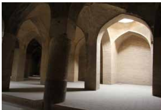
تصویر شماره ۶: قسمت‌های بازسازی شده با ستون‌های مستطیلی