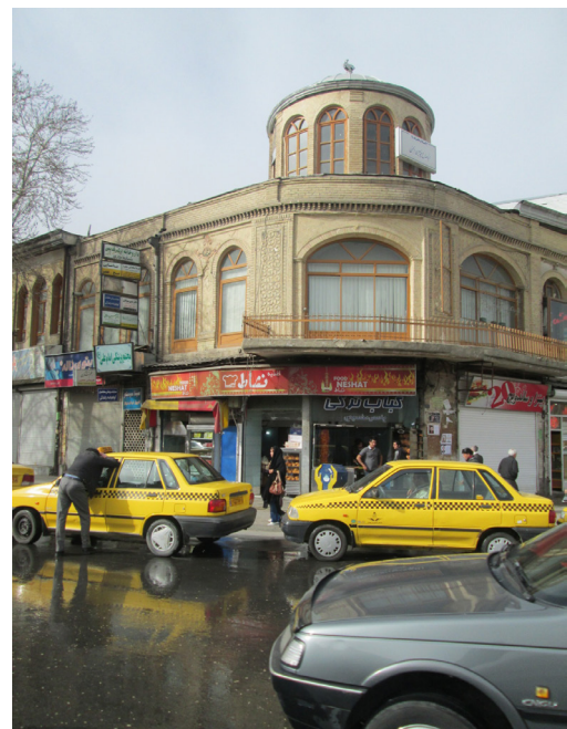
تصویر شماره ۱: تضاد و ناهمخوانی

تصویر شماره ۱ نشانگر ورودی خیابان بوعلی از سمت میدان امام است و یکی از گنبد‌های قدیمی دوازده‌گانه را نشان می‌دهد.