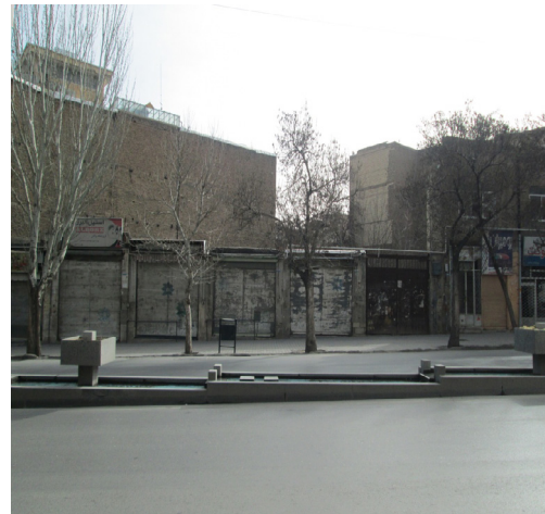
تصویر شماره ۵: فرسودگی، مأخذ: نگارنده