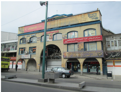
تصویر شماره ۳: نماهای ناهمگون، مأخذ: نگارنده

یکی از مشکلات اصلی خیابان بوعلی ناهمخوانی معماری طبقه دوم و اول است. در حد فاصل این طبقات تابلوهای جدیدی نصب شده است که هیچ هماهنگی بصری با هم ندارند و آشفته‌گی بصری شدیدی ایجاد کرده‌اند (تصویر شماره ۲).