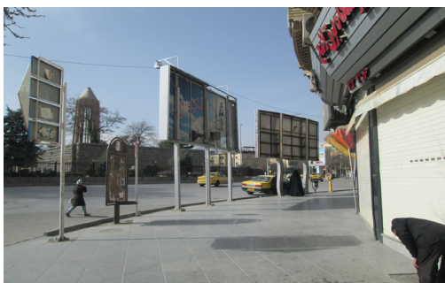
تصویر شماره ۴: مبلمان شهری، مأخذ: نگارنده

ناهمگونی و نداشتن شکل واحد و مناسب برای مبلمان شهری موجود (تابلوهای تبلیغاتی، صندوق‌های برق و مخبرات و...) باعث آشفته‌گی و ناهمخوانی با زمینه‌های فرهنگی و تاریخی این محور شده است (تصویر شماره ۳ و ۴).