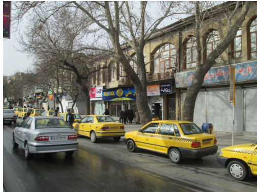
تصویر شماره ۲: آشفته‌گی بصری

نمودار شماره ۲: عناصر معماری جداره تاریخی خیابان بوعلی