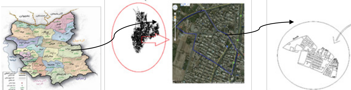
تصویر شماره ۱: پلان شهر و محدوده سایت

شهرستان بناب با وسعت ۷۷۹ کیلومتر مربع در جنوب غربی استان آذربایجان شرقی و در جلگه‌ای صاف و هموار قرار دارد. براساس نتایج سرشماری عمومی نفوس و مسکن در سال ۱۳۹۰، جمعیت شهرستان بناب در حدود ۱۲۹۷۹۵ نفر و جمعیت مرکز این شهرستان ۷۹۸۹۴ نفر و تعداد ۳۷۳۸۰ خانوار است. محله فرهنگیان واقع در شمال غربی بناب با جمعیتی بالغ بر ۲۱۶۰ نفر، از لحاظ حوزه نفوذ و خدمات‌رسانی به منطقه نقش محله‌ای و فرامحله‌ای قرار دارد. محله کوی فرهنگیان در حدود سال ۱۳۶۰ در جهت اجرای سیاست زمین شهری دولت جمهوری اسلامی در اختیار قشر فرهنگی و کارمند شهرستان بناب قرار گرفت. ابتدا قسمت میانی و واحد همسایگی هسته مرکزی شکل گرفت و پس از آن از سال ۱۳۷۵ کوی میلاد با حضور قشر بالای جامعه توسعه یافت ( http://www.ostan-as.gov.ir )