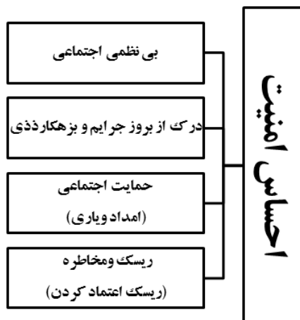
نمودار شماره ۱: الگوی تحلیلی عوامل تأثیرگذار بر احساس امنیت

در الگوی تحلیلی حاضر بر رابطه یک سوبه میان متغیرها تأکید شده است. با وجود این، رویکردهای نظری مورد بررسی، غالباً به رابطه دوسویه و متقابل متغیرها توجه می‌کنند. چنان که برخی نظریه‌ها بر این نکته تأکید می‌کنند که بی‌نظمی اجتماعی می‌تواند ریسک و مخاطره (ریسک اعتماد کردن) را ایجاد کند و ریسک و مخاطره نیز سبب احساس ناامنی و ترس می‌شود. هم‌چنین احساس ناامنی و ترس نیز به نوبه خود می‌تواند موجب کناره‌گیری افراد از فعالیت‌های اجتماعی، به خصوص زنان و محدودشدن ارتباطات آن‌ها و تضعیف کنترل اجتماعی غیررسمی شود و زمینه مناسبی را برای بی‌نظمی اجتماعی فراهم سازد. در واقع چرخه‌ای معیوب میان بی‌نظمی اجتماعی، ریسک و مخاطره و احساس ناامنی و ترس وجود دارد که می‌تواند یکدیگر را تولید و بازتولید نمایند.