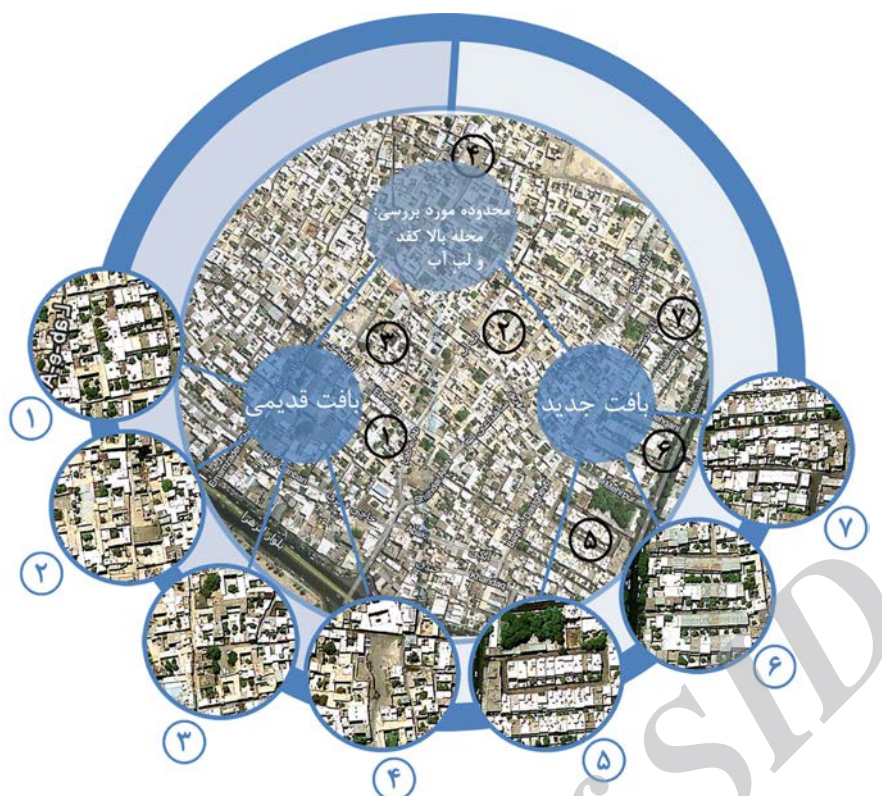
تصویر شماره ۲: عکس هوایی، تدقیق محدوده مورد بررسی شمال، مقیاس: ۱/۶۰۰۰

می‌کرد؛ درحالی‌که با توجه به ارتفاع بالاتر از ۲/۵ متری آن از کف مکان، از دید خارج به داخل جلوگیری به عمل می‌آورد. این امر در ایجاد محرمیت در وهله نخست و از سوی دیگر، افزایش نظارت ساکنان بر محیط زندگی تأثیر داشته است.