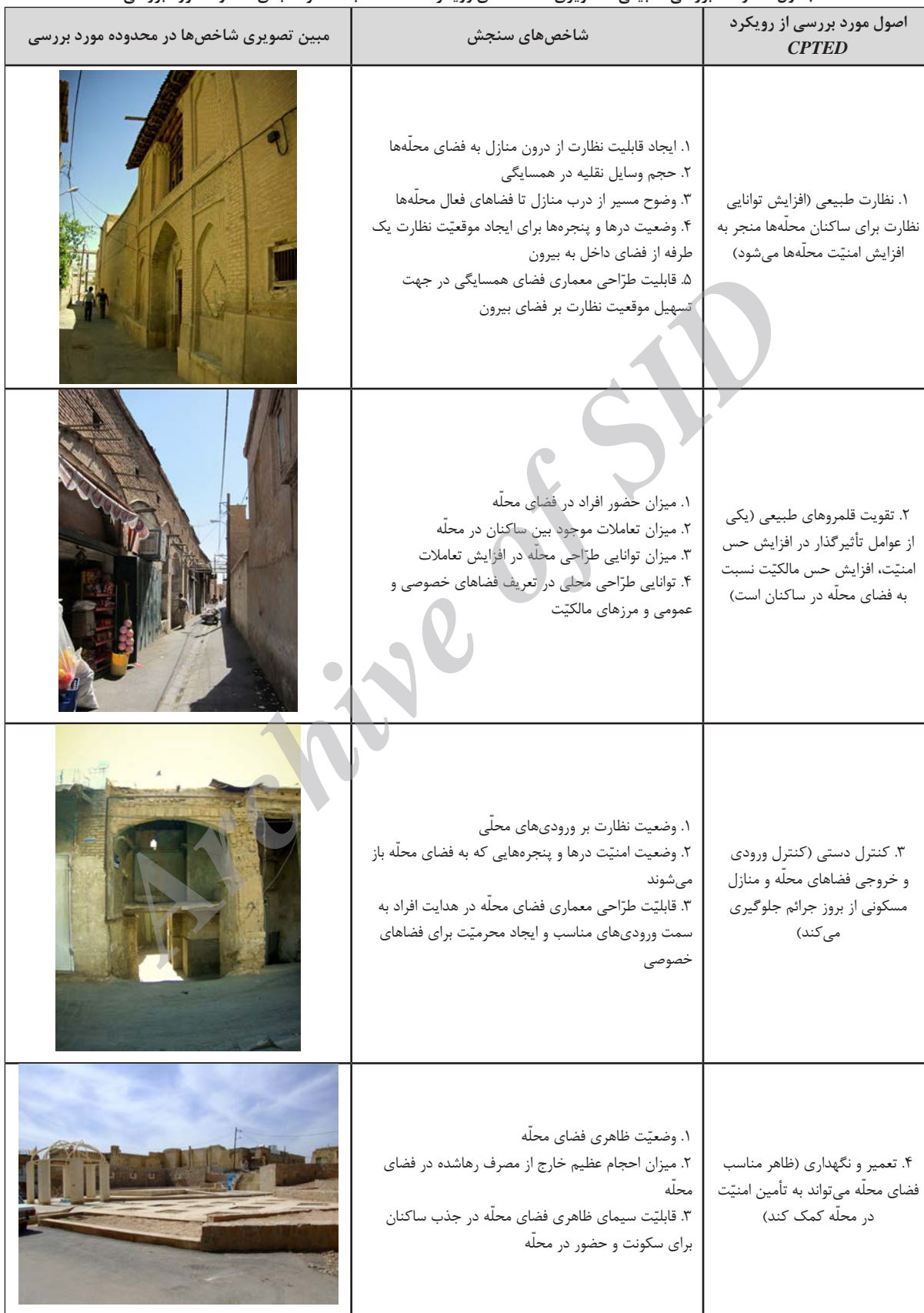
جدول شماره ۳: بررسی تطبیقی - تصویری شاخصه های رویکرد CPTED با عناصر کالبدی محدوده مورد بررسی

فراهم کرد. رعایت این اصول می تواند احساس امنیت شهروندان را افزایش دهد و باعث افزایش میزان رضایت مندی شهروندی گردد که یکی از راه های افزایش رفاه اجتماعی در شهر به شمار می آید.