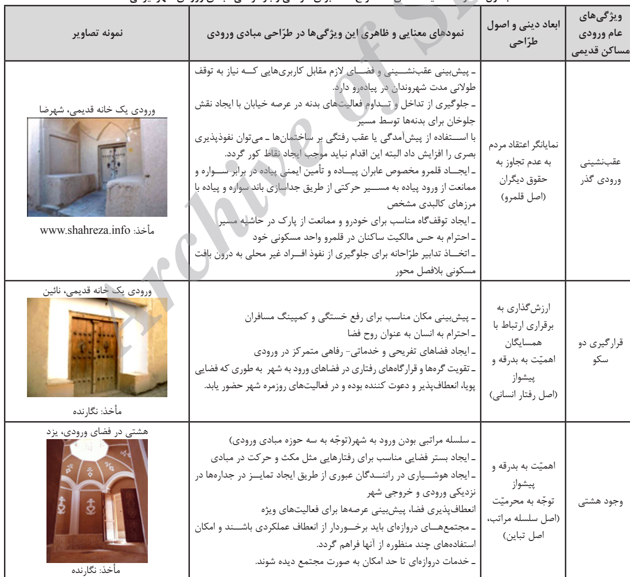
جدول شماره ۱۰: سیاست های استخراج شده برای طراحی و بازطراحی مبادی ورودی شهر ایرانی

که به هم پیوند می یابند، منطبق سازد. ورودی شهرها در گذشته فضای آماده شدن برای آزمودن تجربه جدید بود. فضایی برای پیوند میان آن چه که گذشت و آن چه که در پیش روست. فضایی که شخص در آن می آزمود تا برای آزمودن تجربه های جدید آماده شود. در این پژوهش با بررسی ویژگی های ۲۰ نمونه ورودی مسکن قدیمی در دوره ها و سبک های مختلف (جدول شماره ۲ تا ۴)، سیاست های مرتبط برای طراحی و بازطراحی مبادی ورودی شهر ایرانی استخراج شد تا ورودی شهرها، نه فقط یک فضا که مکانی پذیرای فعل ورود با تمام آداب و ویژگی هایش باشد. در نتیجه، تمام این سیاست ها در جهت طراحی و بازطراحی فضای ورودی با تأکید بر جنبه های کالبدی-فضایی، ارتباطی و عملکردی در جهت معکوس نمودن فرایند افت شهری و رونق چند بعدی این بخش از شهر می تواند مورد استفاده قرار گیرد. این سیاست ها در جدول شماره ۱۰ جمع بندی شده اند.