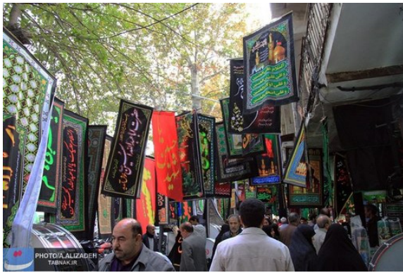
تصویر شماره ۱: تغییرات کالبدی حاصل از آیین مذهبی در ظاهر شهر بیش‌تر شامل تغییر در رنگ شهر (سیاهپوش شدن)، نصب پرچم و تابلوها و ... است.