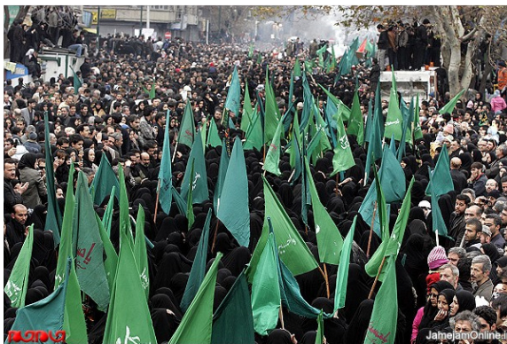
تصویر شماره ۲: تغییرات غیر کالبدی و عوامل انسانی نظیر حرکت دسته‌های عزاداری، شلوغی‌ها و تجمع‌های مردمی و اجرای مراسم نوحه‌خوانی و تعزیه نیز از عناصر شاخص دیگر در تغییر منظر شهر در این ایام هستند.

در پاسخ پرسش "آیا در ایام آیین مذهبی عاشورا شاهد تغییراتی در نما و کالبد شهر هستید؟" نتایج نشان می‌دهد که ۴۱/۲ درصد تغییرات را در حد زیاد، ۲۶ درصد خیلی زیاد، ۲۴/۴ درصد متوسط، ۶/۹ درصد خیلی کم و ۱/۵ درصد تغییرات را در حد کم دانسته‌اند. بنابراین مشاهده می‌شود که مردم تغییرات حاصل از این مراسم را در شکل شهر به میزان قابل توجهی محسوس می‌دانند.