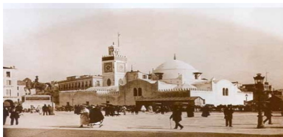
تصویر شماره ۱: مسجد جامع جدید شهر الجزیره به عنوان نشانه‌ای شهری منتج از وقف، مأخذ: Ben-Hamouche, 2007: 37

که این تحلیل‌ها و شناسایی کاستی‌های وقف در زمان خود صورت نگرفته است، عقب‌ماندگی سازمان وقف پیش آمدگی سازمان‌های دولتی و حکومتی را با خود به همراه می‌آورد. این دو موضوع توسط اندیشمندان مختلف در این زمینه مطرح شده است (Stern, 1970:25-50; Gerber, 1999:84). کوران نیز ادعا می‌کند که این نوع عدم انعطاف‌پذیری سازمانی در کنار عدم انعطاف‌پذیری عملیاتی در اجرا، در عوض برای سایر مدل‌های سازمانی خیریه برخوردار از این دو ویژگی همانند TRUST در غرب بسیار سودمند بوده است (Kuran, 2001:862,867). الگوی وارداتی شرق از شهرداری به همراه از دست رفتن مفهوم و ماهیت وقف از یک سو و تقویت سازمان شهرداری غربی با سابقه بر گرفته از قرن ۱۱ میلادی در اروپا (Ibid:878) به همراه حفظ ویژگی‌های وقف در غرب، دستاورد این داد و ستد دو طرفه در ابتدای قرن بیستم برای این دو سیستم فکری است. در این خصوص باید توجه داشت که در حال حاضر، قابلیت امکان مشارکت شهروندان شهرهای غربی در تأمین بخشی از کالاهای عمومی، میراث دار این داد و ستد است. کوران در مطالعه سال ۲۰۰۴ خود به این موضوع به عنوان یکی از تناقضات برجسته چهارگانه شرق و غرب یاد کرده است (Kuran, 2004:78). تصاویر زیر گویای حضورپذیری وقف به عنوان یکی از عناصر حیاتی سازنده شالوده و سیمای شهر در طول تاریخ و در امتداد نیازمندی به روش‌های تبیین تاریخی و انتقادی در شهرهای ملل اسلامی است.