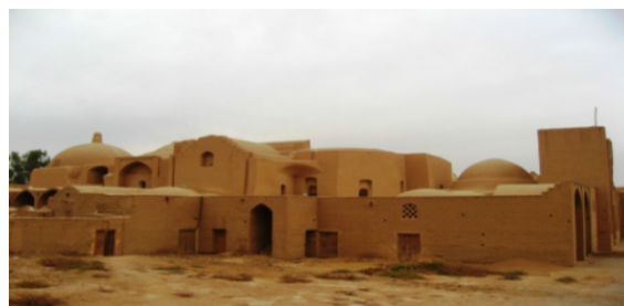
تصویر شماره ۲: مجموعه وقفی خانقاه بندرآباد یزد، مأخذ: پورمند و دیگران، ۱۳۹۴: ۶۸