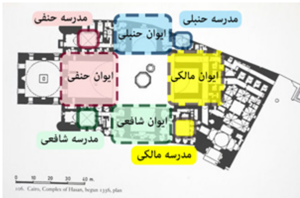
تصویر شماره ۴: مسجد و مدرسه سلطان حسن، ایوان و مدرسه چهار فرقه در ضلع مسجد

و چپ قبله به ترتیب مربوط به مذهب حنبلی و شافعی است. قسمت بندی چهار مذهب به چهار سالن که به صورت چلیپا قرار گرفته‌اند، یک قسمت بندی کلاسیک است که به مدل‌های معروفی مانند مدرسه نظامیه در نیشابور و مدرسه مستنصریه بغداد بر می‌گردد (بورکهارت، ۱۳۹۲: ۱۵۳).