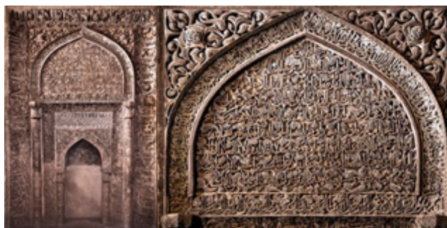
تصویر شماره ۲: محراب الجایتو، تزئینات گچ‌بری محراب با نام ۱۲ امام نشان از حضور تشیع در این مسجد جامع دارد.

آغاز فرقه‌گرایی و چه بسا رشد اساسی فرقه‌گرایی در اسلام را باید از آن روزی دانست که مسلمانان در یک صف بندی کاملاً متمایز به مناقشه بر سر موضوع امامت و رهبری جامعه پرداختند. آنان نه تنها اختلاف خویش را درباره مصادیق امام و جانشین پیامبر(ص) ظهور و بروز دادند، بلکه در شأن و ویژگی‌های آن نیز به مشاجره پرداختند. جالب این‌که هر کدام نیز بر سیره و سخنان پیامبر(ص) تکیه می‌کردند. براساس این دیدگاه حتی می‌توان از این