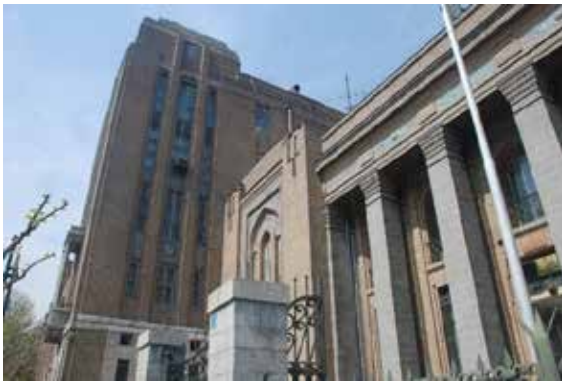
تصویر شماره ۳: نمای جنوبی ساختمان کمپانی نفت ایران و انگلیس