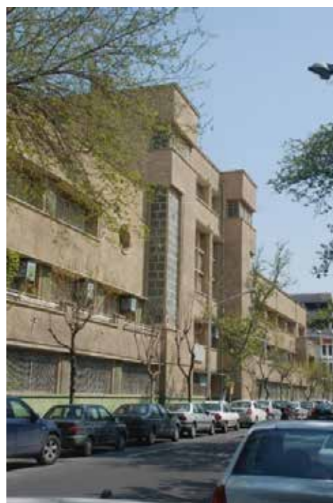
تصویر شماره ۱۱: هنرستان دختران؛ مأخذ: نگارنده

اولین ساختمانی که به شیوه بین‌الملل ۳۵ در ایران و در سال ۱۳۱۴ ساخته شد، ساختمان هنرستان دختران در خیابان سرهنگ سخایی (سوم اسفند) است (سروشانی، ۱۳۷۸: ۴۳). پلان ساختمان به صورت U شکل و متقارن و به گونه‌ای مشابه پلان ساختمان‌های نئوکلاسیک غرب است. دو نمای اصلی جنوبی و شمالی نیز متقارن هستند. اما وجه غالب این ساختمان، یک بنای کاملاً مدرن و در چهارچوب سبک بین‌الملل است. وارطان در طراحی این بنا فقط از خطوط مستقیم استفاده کرده است. به جز راه پله و بام شیب‌دار، در ساختمان هیچ گونه خط شکسته، مورب یا منحنی مشاهده نمی‌شود. بام شیروانی ساختمان هم کوتاه است و از محوطه بیرون ساختمان دیده نمی‌شود. سایه‌بان‌ها، قرنیزها، بالکن‌ها و نرده‌های افقی و مستقیم و پنجره‌های کشیده سرتاسری، از مشخصات بارز نمای این بنا است. سازه بنا اسکلت بتنی است و نمای آن با سیمان پوشش داده شده است (قبادیان، ۱۳۹۲: ۲۱۱). ساختمان هنرستان دختران در بین بناهای بررسی شده در این پژوهش تنها بنایی است که به صورت کامل ضد زمینه است. این بنا با عملکردی نو، هم در ساختار و هم در مصالح ساختمانی کاملاً وارداتی بوده است.