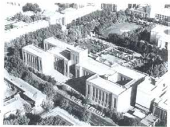
تصویر شماره ۸: ساختمان وزارت امور خارجه؛ مأخذ: بانی مسعود، ۱۳۸۸: ۲۴۵

ساختمان کاملاً از سنگ یکپارچه ساخته شده و حتی نقوش تزئینی اطراف بام از همان جنس هستند. این نقوش و متیف‌ها که عمدتاً تکرار گل‌هایی در یک باند کشیده سرتاسری هستند به شکلی کاملاً مجرد و پالایش یافته و بدون آنکه نقوش معماری گذشته را عیناً بازسازی کنند به کار گرفته شده‌اند (پاکدامن، ۱۳۷۶: ۲۱۳). تأثیراتی از سایر سبک‌ها نیز در این بنا دیده می‌شود چنان‌چه در مورد برج میانی کاخ وزارت امور خارجه آمده است «کاخ وزارت امور خارجه، که در نوع خود یکی از بناهای بی نظیر تهران و ایران است، ظاهراً با الهام از کعبه زرتشت، یکی از بناهای استوار هخامنشیان در پای آرامگاه‌ها شاهان هخامنشی در نقش رستم ساخته شده است» (رجیبی، ۱۳۵۵: ۵۰).