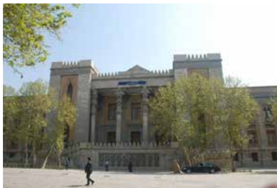
تصویر شماره ۶: نمای غربی کاخ شهربانی-ورودی اصلی بنا؛ مأخذ: نگارندگان