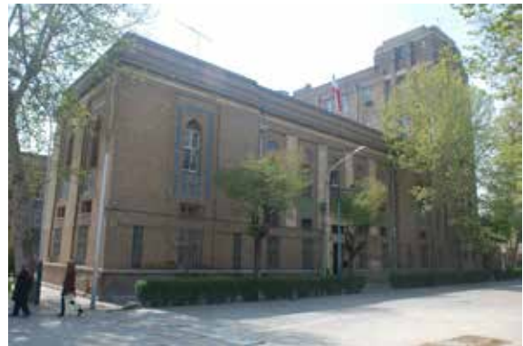
تصویر شماره ۲: نمای شمالی کمپانی نفت ایران و انگلیس