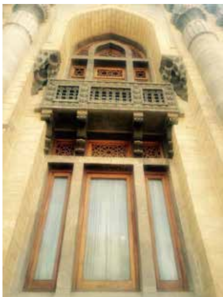
تصویر شماره ۷: تزئین های دور پنجره کاخ شهربانی

از بین بناهای بررسی شده در این پژوهش کاخ شهربانی تنها بنایی است که به صورت کامل با زمینه پیشین خود در تعامل است. از مواردی که در رویکرد زمینه گرایي این بنا می توان به آن ها اشاره کرد ساختار سازه ای بنا است که مطابق با ساختمان های هم دوره خود است. در بازشوهای نمای غربی بنا هم از تزئین های متناسب با زمینه پیشین (کاخ گلستان) استفاده شده است. بر اساس رویکرد منطقه گرایي این بنا، نظام گردش ورودی آن بر اساس نظام گردش بناهای کهن ایران زمین است، با تزئین های منطقه ای این بنا که عموماً به معماری دوران هخامنشیان باز می گردد. گونه ورودی بنا در ساختار طرح و قوس های جناغی در تزئینات جزء رویکرد گونه شناسی این بنا است.