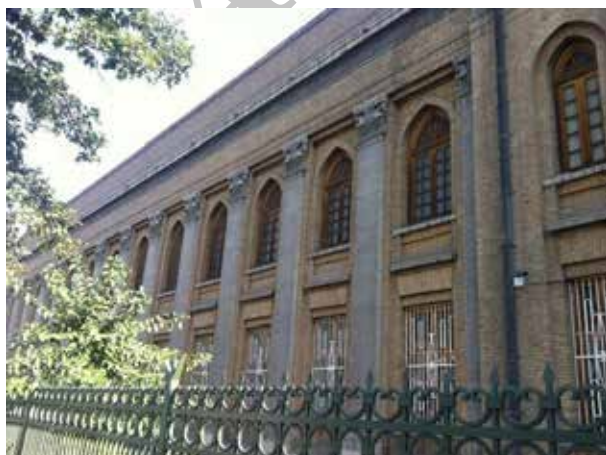
تصویر شماره ۵: نمای جنوبی ساختمان اداره پست؛ مأخذ: نگارندگان