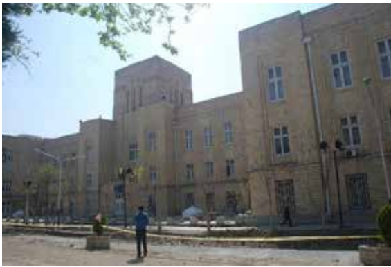
تصویر شماره ۹: نمای شمالی ساختمان وزارت امور خارجه؛ مأخذ: نگارندگان

این ساختمان بین سال‌های ۱۳۱۲-۱۳۱۸ در سمت غرب میدان مشق روبه‌روی ساختمان قزاقخانه احداث شد. ساختمان در سه طبقه طراحی شده است. بخش میانی بنا، مرتفع‌تر از سایر قسمت‌ها و به صورت یک برج مکعب مستطیل چهارطبقه است. طراحی یک برج در میان ساختمان، از جمله نمادهای سبک آرت دکو در این بنا است. در بالای این برج و سرتاسر بخش فوقانی ساختمان از تزئین‌های آرت دکو استفاده شده است. نرده‌های جلوی پنجره‌های طبقه اول نیز به تبعیت از فرم‌های آرت دکو طراحی شده‌اند (قبادیان، ۱۳۹۲: ۲۰۵).