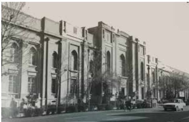
تصویر شماره ۴: نمای جنوبی ساختمان اداره پست؛ مأخذ: بانی مسعود، ۱۳۸۸: ۲۱۴