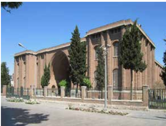
تصویر شماره ۱۰: موزه ایران باستان؛ مأخذ: نگارندگان

بهترین و بازرترین جلوه معماری ساسانی در این دوره را می‌توان در طراحی موزه ایران باستان ۱۳۱۵-۱۳۱۲ ملاحظه کرد. نمای اصلی این ساختمان با الهام از طاق کسری در تیسفون طراحی شده است. این ساختمان که با آجر قرمز رنگ اجرا شده در سمت غرب میدان مشق و در تقاطع خیابان امام خمینی و سی تیر واقع است (قبادیان، ۱۳۹۲: ۱۹۱). بارزترین نمادهای این ساختمان که تداعی‌کننده معماری عصر ساسانی است، استفاده از قوس هذلولی برای ورودی ساختمان، آجرهای قرمز رنگ و نیم‌ستون‌های مضرس شکل است (مختاری طالقانی، ۱۳۸۲: ۹۲). موزه ایران باستان در بین بناهای بررسی شده در این پژوهش بهترین نمونه پاسخ به گذشته خیلی دور زمینه بنا، در دو رویکرد منطقه‌گرایی و گونه‌شناسی (که در هر دو رویکرد تاریخچه گذشته بنا مورد نظر است) بوده است.