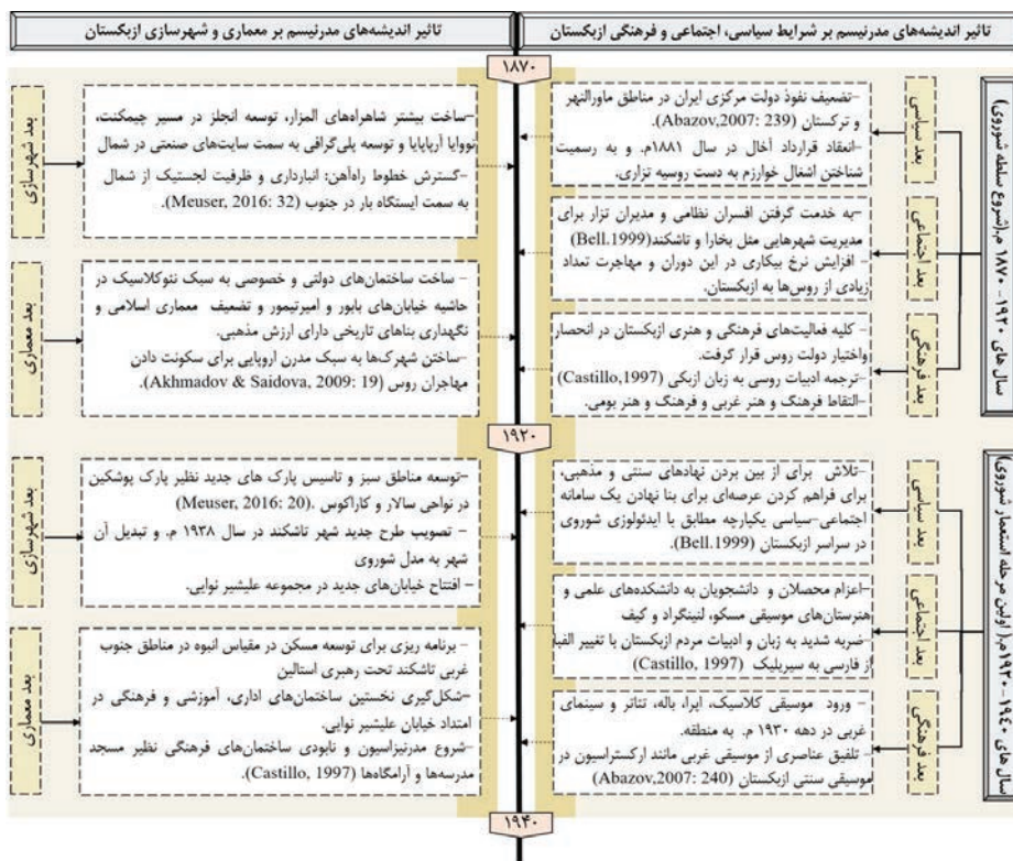
نمودار شماره ۲: فرآیند تاثیر اندیشه های مدرنیسم بر شرایط اجتماعی و فرهنگی و عرصه های معماری و شهرسازی ازبکستان در فاصله سال های ۱۸۷۰-۱۹۴۰ م.؛ ماخذ: نگارندگان

آسیای مرکزی همواره یکی از مراکز مهم فرهنگ و تمدن بشری به شمار می آمده است و ویژگی بارز آن به هم تنیدگی اقوام، مذاهب و ملیت های گوناگون بوده است. در این مناطق شهرنشینی و تمدن در کنار چادرنشینی و صحراگردی وجود داشته و بر یکدیگر اثر گذارده اند. سلطه روس ها بر منطقه آسیای مرکزی زمانی به وقوع پیوست که این منطقه دوران افول فرهنگی را می گذراند. این سلطه، به ویژه در دوران هفتادساله اتحاد جماهیر شوروی سوسیالیستی، تاثیر قابل توجهی بر فرهنگ و هنر این منطقه گذارد. کلیه امور فرهنگی و هنری مرتبط با دین، از خوشنویسی گرفته تا معماری مساجد و مدارس، در این دوره آسیب های فراوانی دیدند و برخی ژانرهای هنری آن ها به کلی از بین رفتند. همچنین تغییر خط رسمی از فارسی