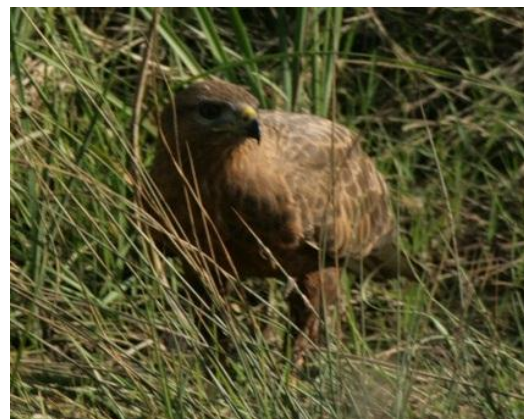
تصویر ۲- سارگپه

مطالعات بسیار کمی در مورد آلودگی پرنده گان وحشی به این تک یاخته صورت گرفته و گزارشی مبنی بر آلودگی سارگپه به این تک یاخته وجود ندارد البته انگل های خونی معمولاً از اکثر پرنده گان و تقریباً از تمام دنیا گزارش شده است (۱ و ۷).